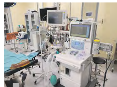
Imponujący sprzęt w sali operacyjnej.