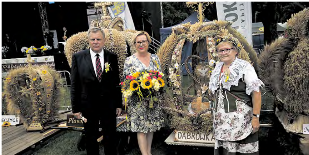
XXII Dożynki Województwa Śląskiego – podczas części oficjalnej.