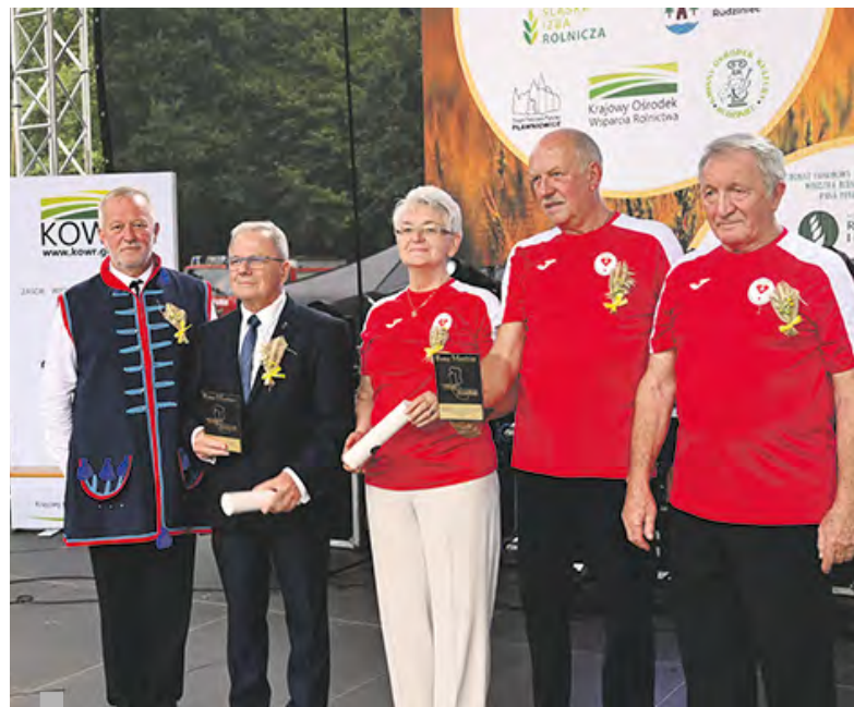
Laureaci Bene Meritus 2022.

Działacz społeczny, animator biegania, zawodnik nieistniejącego już Klubu Sportowego Unia Krywałd. Od 2001 r. jest Rycerzem Orderu Jasnogórskiej Bogarodzicy (od 2001 roku), organizuje pielgrzymki biegowe i biegowo-rowerowe na Jasną Górę, do Marianosztra na Węgry, do Zarwanicy na Ukrainie, i do wielu innych miejsc kultu maryjnego, a także ekstremalne drogi krzyżowe, angażuje się w pomoc charytatywną. Jest posiadaczem wielu wybitnych nagród i odznaczeń. Zawodowo związany z rzemiosłem, pozazawodowo ze sportem, działalnością dobroczynną i społeczną. Poprzez swoje działania promuje powiat gliwicki w kraju i za granicą.