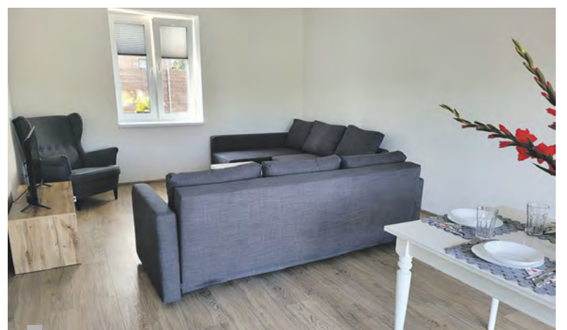
Mieszkania chronione w Bojszowie są naprawdę nowoczesne i przytulne. Zachęcamy do zwiedzania i zamieszkania. Informacji udzielają pracownicy PCPR w Gliwicach.

Tekst i zdjęcia: Magdalena Fiszer-Rębisz