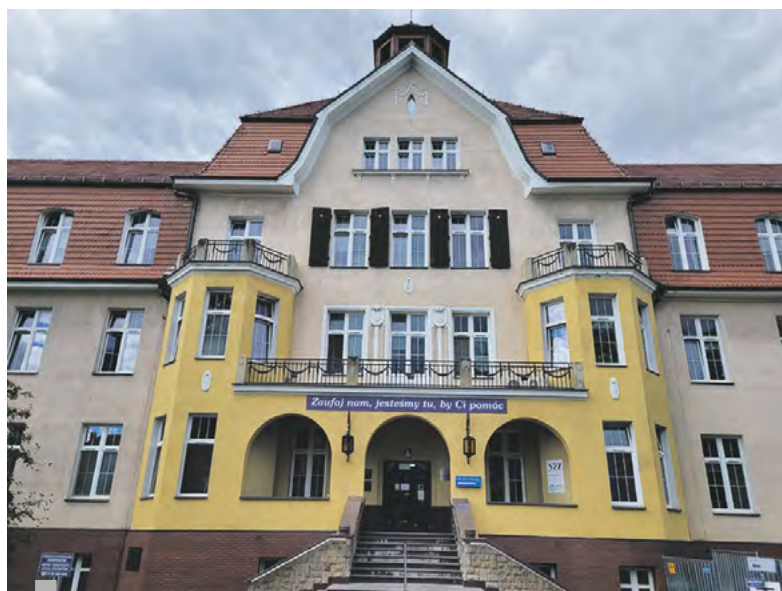
Budynek Szpitala w Knurowie Sp. z o.o. wciąż się zmienia dla naszych pacjentów.

objawów, z którymi pacjent zgłasza się do lekarza, jest dużym problemem. Często powoduje odwlekanie wizyty, a to przekłada się na opóźnienie postawienia rozpoznania i gorsze rokowanie. Tylko wcześniej zdiagnozowany nowotwór daje szansę na wyleczenie. Im później, tym gorzej. I będę szczery - późno wykryty, zaawansowany nowotwór złośliwy jest nie do wyleczenia. Dlatego edukacja zdrowotna ma tak gigan-