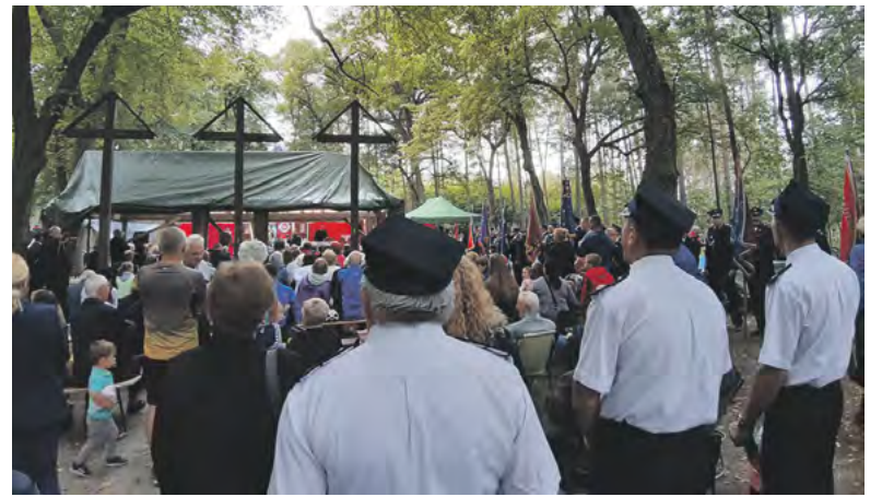
Na mszy świętej w „Magdalence” we wspólnej modlitwie zjednoczyli się prawdziwe tłumy tych, co pamiętają wielki pożar lasów lub o nim słyszeli.

Pisząc o pożarze sprzed 30 lat nie sposób nie wspomnieć o kaplicy św. Marii Magdaleny między Tworogiem Małym a Goszycami, która cudownie ocalała z wielkiego pożaru. Popularna „Magdalenka” pozostała symbolem przypominającym o wielkiej tragedii i jej ofiarach. Właśnie tam, w intencji strażaków walczących w pożarze,