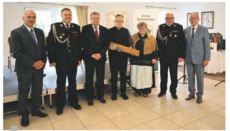
Konferencja w Sośnicowicach była niezwykle ciekawa.

Poza oficjalnymi uroczystościami w naszym powiecie odbyły się także inne ciekawe imprezy, takie jak „Bieg ku czci zmarłych i wszystkich, którzy zmagali się w wielkim pożarze lasu w 1992 roku”, czy też Rodzinny Rajd Rowerowy upamiętniający tenże pożar.