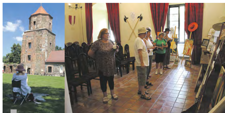
Plener malarski na dziedzińcu zamkowym w Toszku.