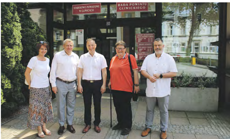
Goście z powiatu puckiego ze starostą gliwickim.