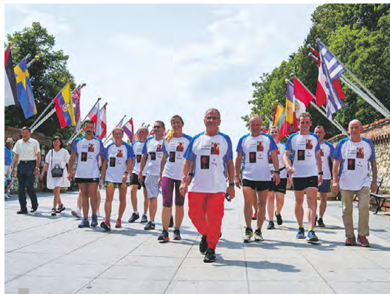
Biegacze u bram Jasnej Góry.