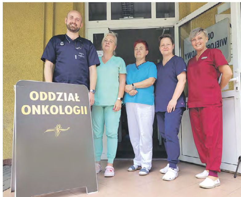
Taka sympatyczna kadra wykwalifikowanych specjalistów cierpliwie i z oddaniem leczy chorych i opiekuje się nimi, jak również ich rodzinami.

Zdjęcie Rafała Kurzawy – archiwum prywatne