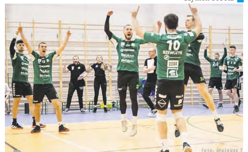
Zawodnicy nie kryją radości.