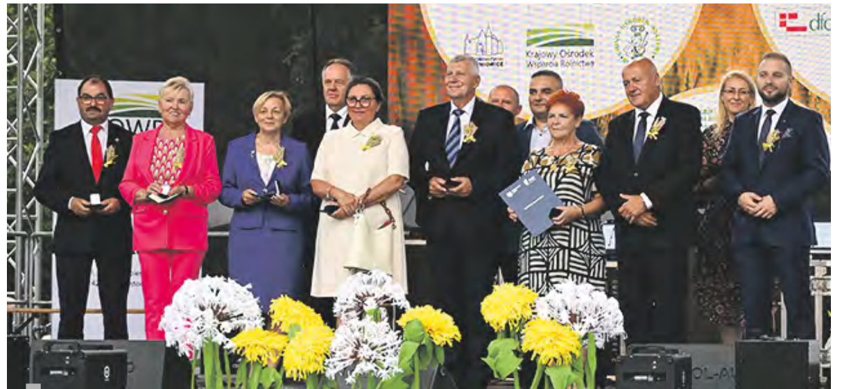
Nagrodzeni Honorowymi Odznakami za Zasługi dla Województwa Śląskiego