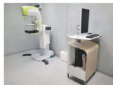
Nowy mammograf wygląda znakomicie. Już niebawem zacznie się tutaj badanie pacjentek.