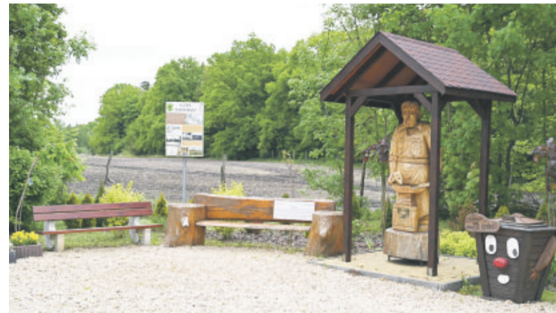
Zarówno skwer, jak i cała aleja stanowią miejsce edukacji ekologicznej.

Ilość realizowanych zadań nie byłaby możliwa, gdyby nie wysoki fundusz sołectki i wsparcie Gminy Pilchowice, jak również dobry kon-