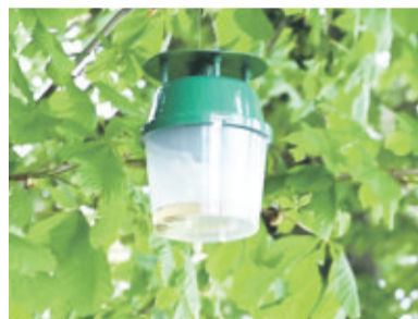
Jedna z pułapek feromonowych na owady zagrażające kasztanowcom.

Istotnym przedsięwzięciem w przyszłości jest remont przy-