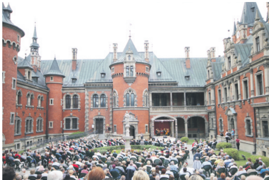
Koncerty w Pławniowicach mają niepowtarzalny urok i wierną publiczność.

– Ta cykliczna impreza dostarcza zawsze licznie przybywającej publiczności wielu niezapomnianych wrażeń artystycznych – podkreśla