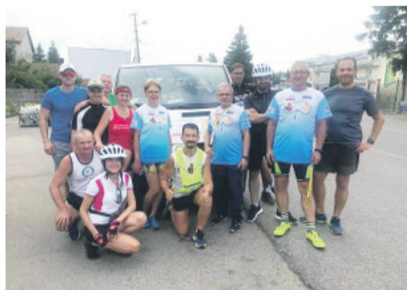
Gdzieś na trasie.