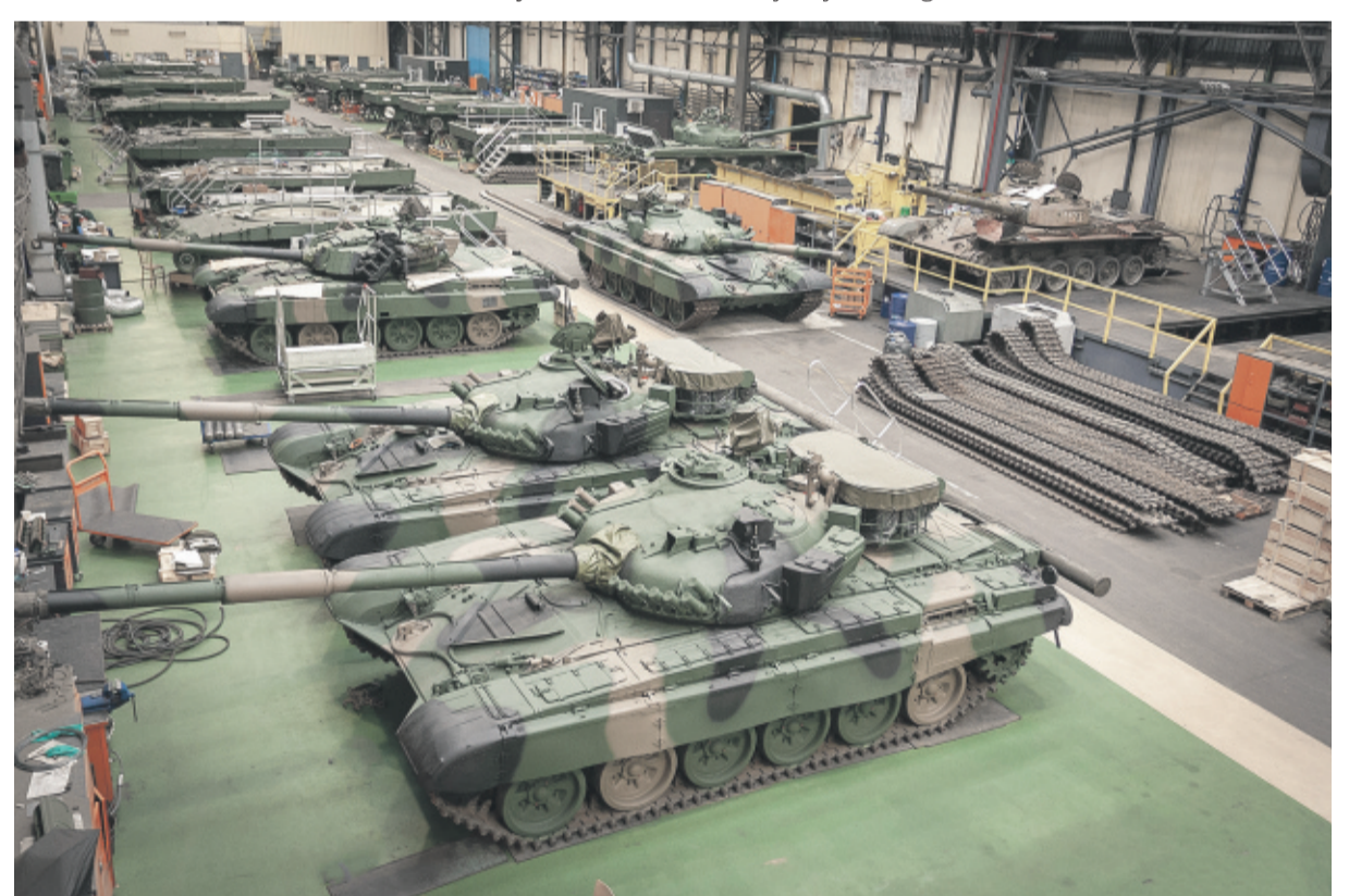
Hala produkcyjna ZM „Bumar-Łabędy” S.A.

WPG: Przez lata zakład zatrudniał mieszkańców powiatu gliwickiego. Czy tak jest również obecnie?