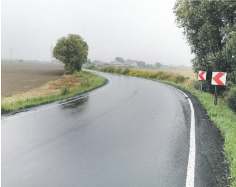
Nowa nawierzchnia ul. Szkolnej w Chudowie.

Nową nawierzchnię ma już także ul. Szkolna w Chudowie prowadząca w kierunku Bujakowa. Wyremontowano tu pół km drogi. Prace zostały zakończone 23 lipca. Inwestycja ta była realizowana przez Powiat Gliwicki przy dofinansowaniu Gminy Gierałtowice w ramach programu „Inicjatywa Samorządowa”.