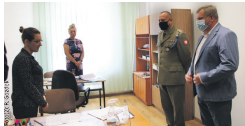
W trakcie kwalifikacji siedzibę WKU odwiedził starosta Waldemar Dombek.