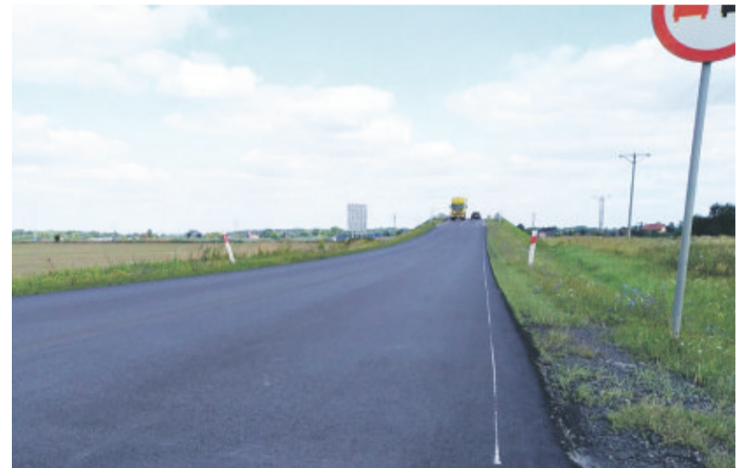
Wyremontowane dojazdy do wiaduktu nad autostradą A-4 w Kozłowie.

cze w tym miesiącu. Obydwie inwestycje prowadzone są w ramach programu „Inicjatywa Samorządowa”.