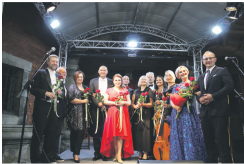
Grono wykonawców i organizatorów operetkowego wieczoru.