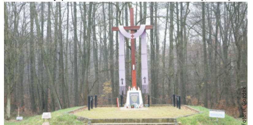
Krzyż Partyzancki na polanie „Hubertus”.