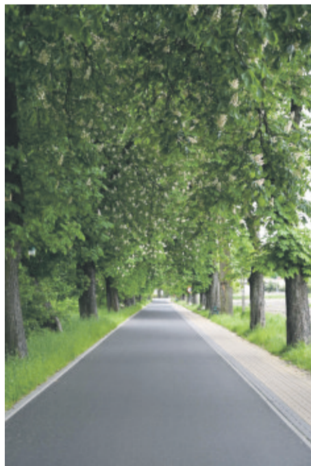
Urok alei jest nieodparty.