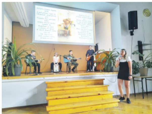
Podczas akademii rozpoczynającej rok szkolny w Zespole Szkół im. M. Konopnickiej w Pyskowicach.

no-psychologicznej, politechnicznej oraz wojskowej. W Technikum zdobywają w dwóch klasach zawód technik logistyk, przy czym jedna z nich ma profil mundurowy. W ra-