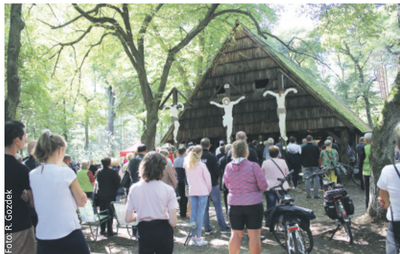
W tym roku do Magdalence przybyło wyjątkowo dużo wiernych.