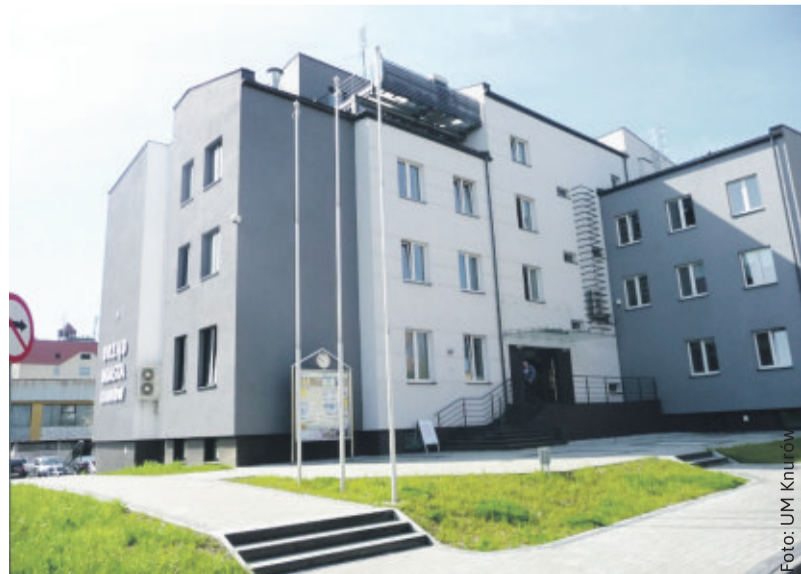
Punkt działa w budynku Urzędu Miasta Knurów.

Uruchomienie punktu w Knurowie to ułatwienie dla mieszkańców.