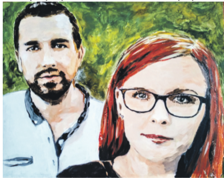
Portret malowany ze zdjęcia.