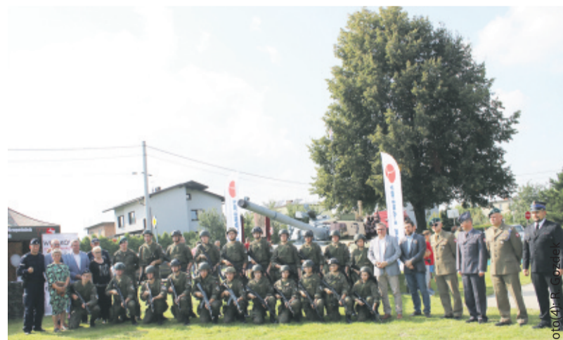
Uczniowie klas mundurowych ZSZ nr 2 w Knuruwie z przedstawicielami organizatorów imprezy.

rytorialnej, gdzie można było m.in. przyjrzeć się z bliska broni wojskowej, a także przybrać barwy wojenne – po pomalowaniu twarzy w taki sposób, jak to robią żołnierze w akcjach specjalnych. Wiele osób próbowało strzelania z karabinu, celując