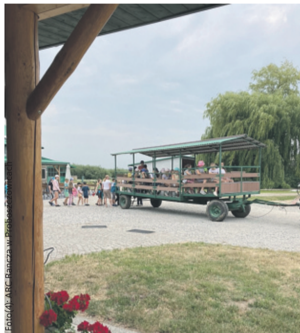
Proboszczowickie Ranczo to świetne miejsce na wycieczki i agroturystykę.