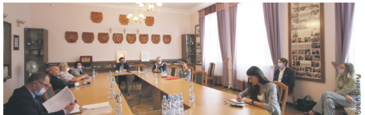
Posiedzenie Komisji Oświaty, Kultury i Sportu.

słuszna, ale do wyjaśnienia są te właśnie wątpliwości, co potwierdzili dziś sami przedstawiciele sto-