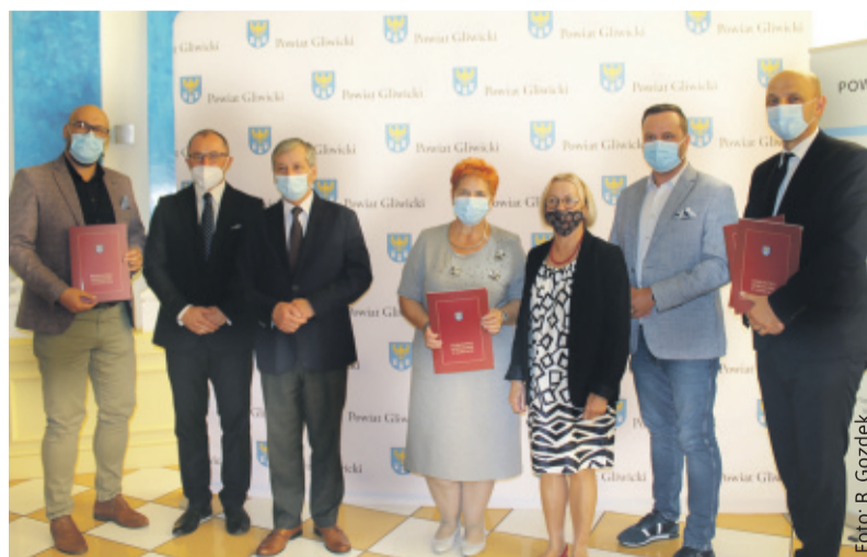
Uczestnicy spotkania w starostwie.

Mikrobusy zakupione dzięki otrzymanemu dofinansowaniu