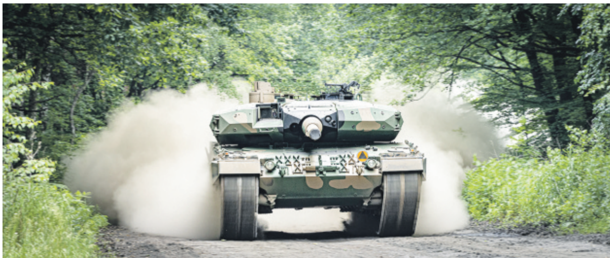
Czołg Leopard 2PL w natarciu.

MK: Przede wszystkim tak, choć w naszych czasach, gdy odległości, w znaczeniu dojazdów do pracy, znacznie się skracają, praca w zakładzie o tej renomie może stanowić również propozycję i wyzwanie dla kandydatów z bardziej odległych lokalizacji.