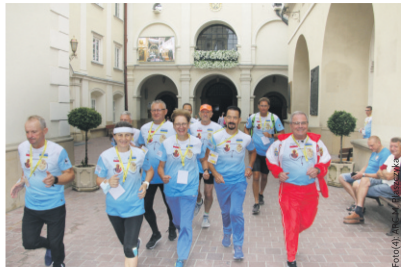
Pielgrzymów – mimo zmęczenia – nie opuszczał uśmiech.

To był ostatni dzień pielgrzymki, podczas której mogliśmy być w dwóch miejscach kultu Maryjnego w Polsce oraz na Ukrainie. Każdy niósł swoje prośby i podziękowania, towarzyszyło nam zdanie wypowiedziane przez św. Jana Pawła II: „Gdziekolwiek jest Maryja, tam obfituje łaska i tam dokonuje się uzdrowienie ciała i duszy”. Bez wątpienia czuliśmy tę obecność Maryi.