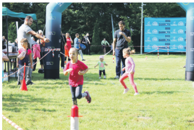
Najmłodsi też cieszyli się z możliwości pobiegania na świeżym powietrzu.

Nowy 10-kilometrowy dystans zawodnicy pokonywali, biegnąc przez malownicze lasy Nadleśnictwa Rybnik, a także piękne zakątki