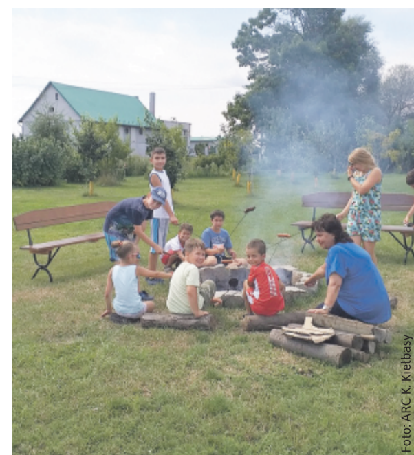
Młodych piłkarzy i ich opiekunów gości będzie Gospodarstwo Agroturystyczne „Ranczo” w Proboszczowicach, znane z propagowania sportu oraz zdrowego sposobu życia wśród dzieci i młodzieży.