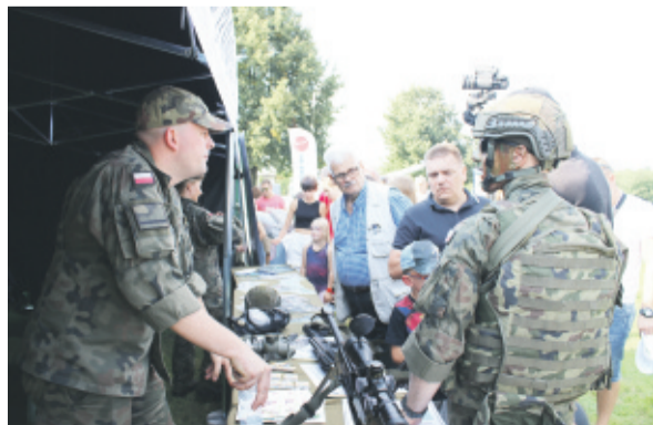
...i poznać tajniki walki.