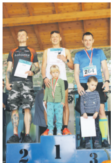
Na podium – zwycięzcy jednej z kategorii nagrody odbierali ze swoimi dziećmi.