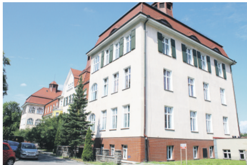
W tej części szpitala modernizowany jest Oddział Chirurgii Ogólnej.

obejmujące m.in. skucie i zerwanie starych posadzek, demontaż ścian działowych i stolarki drzwiowej oraz rozbiórkę istniejących instalacji.