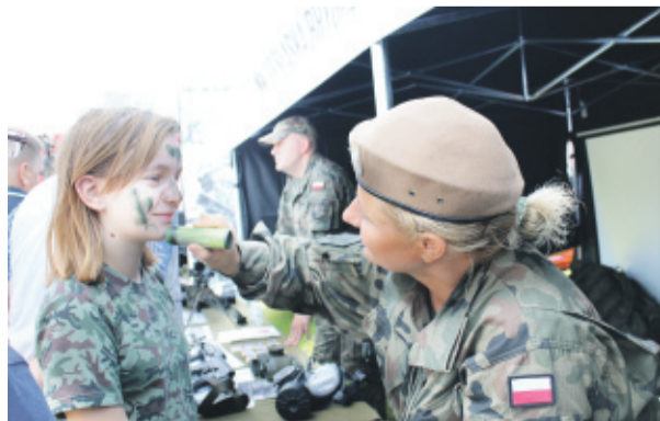
Można było przybrać barwy wojskowe...

PT-91 „Twardy”, prezentowany przez Zakłady Mechaniczne „Bumar-Łabędy” S.A. Wszyscy przy nim się fotografowali, bo nieczęsto jest okazja, by zrobić sobie zdjęcie przed prawdziwym czołgiem. Z równie dużym zainteresowaniem uczestnicy pikniku odwiedzali stoiska 13 Śląskiej Brygady Obrony Te-