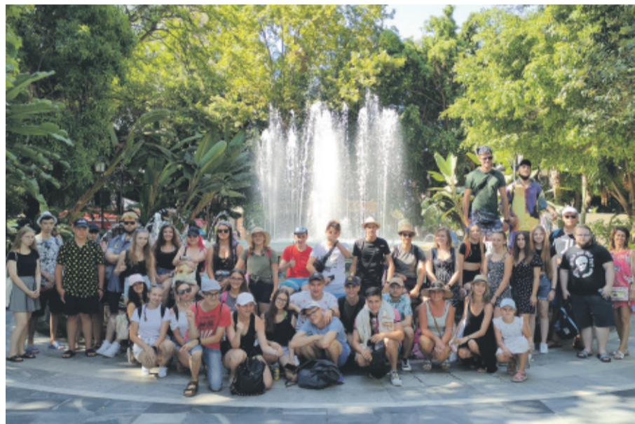
Uczniowie Zespołu Szkół im. I. J. Paderewskiego w Knurowie spędzili wakacje w hiszpańskiej Maladze, odbywając tam praktyki zawodowe.

go BIS” zapewnia uczniom LO dodatkowe zajęcia wyrównawcze i rozwijające zainteresowania. W ramach projektu „Dobre wykształcenie – lepsza praca BIS” uczniowie odbywają płatne staże u krajowych pracodawców, zaś szkoła wyposażona zostanie w sprzęt komputerowy i elektroniczny. Cennym osiągnięciem jest zrealizowany w tym roku projekt ERASMUS Plus: „Paderek na europejskim szlaku w poszukiwaniu doświadczenia zawodowego” o wartości blisko 148 tys. euro. 64 uczniów podzielonych na dwa turnusy uczestniczyło w trudnym czasie COVID-19 w praktykach zawodowych w hiszpańskiej Maladze, przywożąc stamtąd cenne doświadczenie zdobyte u iberyjskich pracodawców oraz certyfikaty wzbogacające ich życiorysy zawodowe.