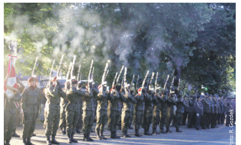
Salwa honorowa podczas uroczystości pod pomnikiem Marszałka Józefa Piłsudskiego.