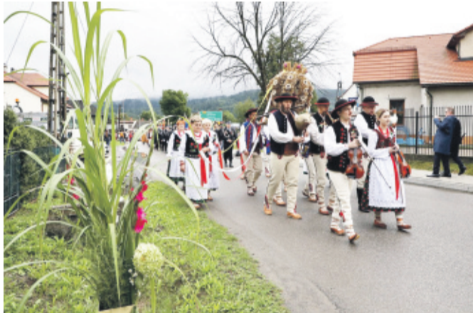
Dożynki Wojewódzkie zorganizowano tym razem w Jelesni, nie zabrakło więc góralskich akcentów.

łę 22 sierpnia w Jelesni. I w tym przypadku dożynkowa tradycja powróciła po rocznej przerwie spowodowanej pandemią. Rolnikom