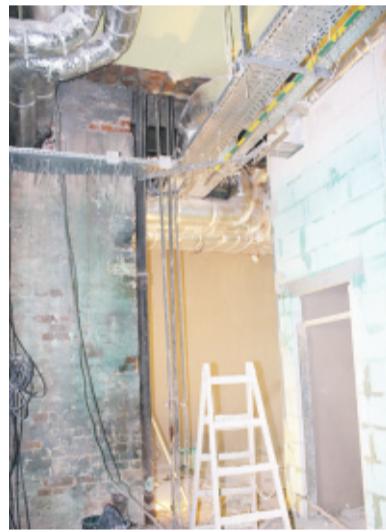
Jedno z remontowanych pomieszczeń.

W ramach wykonywanych prac zmieniony zostanie poprzedni układ funkcjonalno-przestrzenny oddziału, który mieści się na parterze szpitala.