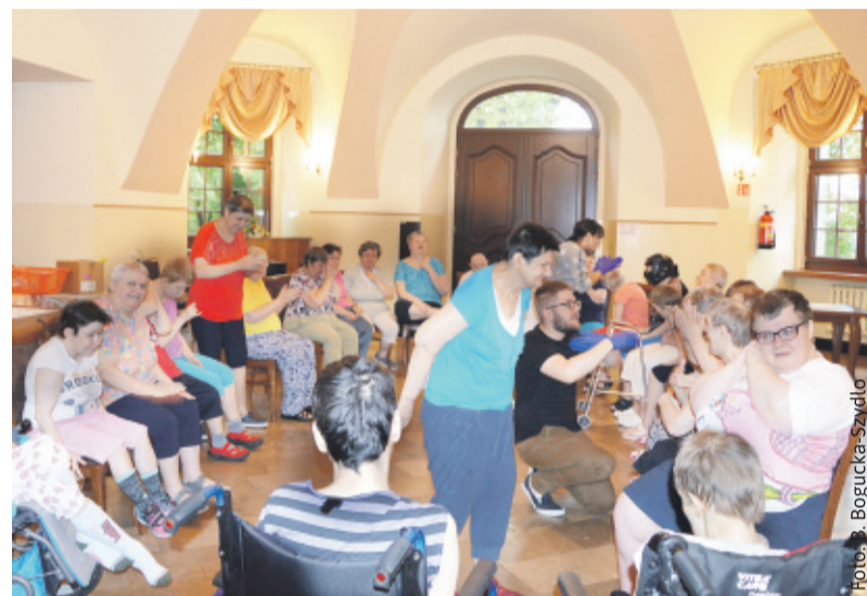
Choroba pozostawia po sobie zmiany, które wymagają rehabilitacji.

Analiza uzyskanych w ten sposób wyników pokazała, że u niektórych podopiecznych po zachorowaniu na Covid 19 wystąpił regres poznawczy (mgła pocovidowa). Deficyty dotyczyły przede wszystkim funkcji koncentracji uwagi, spostrzegania, pamięci i rozumowania. Do zajęć usprawniających ruchowo dołączono więc także terapię psychologiczną, w ramach której codziennie prowadzone są zaję-