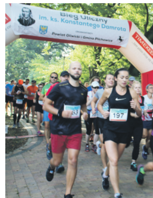
Start i meta biegu zlokalizowane były na terenie parku Damrota w Pilchowicach.

Organizatorzy imprezy: Gmina Pilchowice, Starostwo Powiatowe