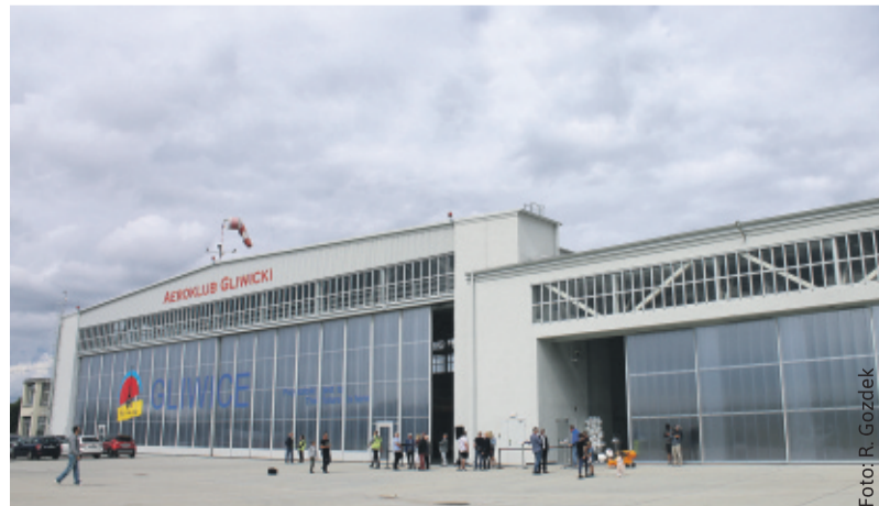
Stary hangar zupełnie zmienił swe oblicze.