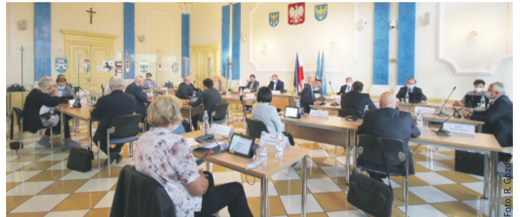
Podczas XXX sesji Rady Powiatu Gliwickiego.

tu Gliwickiego. Na jej mocy – w oparciu o postępowanie prowadzone przez Komisję Skarg, Wniosków i Petycji – Rada Powiatu Gliwickiego odrzuciła wniosek Stowarzyszenia Młodzi Aktywni Gliwice o utworzenie Młodzieżowej Rady Powiatu Gliwickiego. Sprawą tą zajmowały się wcześniej wszystkie komisje naszej Rady. Zwrócono uwagę na liczne kwestie wymagające regulacji istniejącego stanu prawnego, wynikające z utworzenia młodzieżowej rady, takie jak m.in. konieczność podjęcia uchwały o jej utworzeniu, będącej aktem prawa miejscowego podlegającym konsultacjom społecznym. Wymagane jest też przygotowanie jej statutu, określającego w szczególności zasady działania młodzieżowej rady powiatu, tryb i kryteria wyboru jej członków oraz zasady wygaśnięcia man-