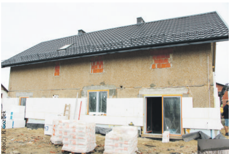
Budynek przechodzi kapitalny remont.

Obecnie trwają w nim intensywne prace remontowo-budowlane. Tworzonych jest tu pięć mieszkań przeznaczonych dla usamodzielniających się wychowanków rodzin zastępczych. Każde z mieszkań będzie się składało z pokoju z łazienką, a w części wspólnej znajdzie się salon z czę-