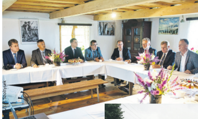
Samorządowcy z powiatów puckiego i gliwickiego podczas rozmów...

Warto wspomnieć, że br. jest w Powiecie Puckim Rokiem Partnerstwa Samorządowego – obchodzi on bowiem 15-lecie współpracy z Powiatem Gliwickim, a także 20-lecie z niemieckim Trier-Saarburg i 14-lecie z litewskim Skuodas. Z tej okazji nasz nadmorski partnerski powiat zadbał o wydanie albumu kulinarnego „Wielka Ucztę Regionów”, w którym znalazły się przepisy na potrawy z tych wszystkich czterech regionów. W następnym wydaniu