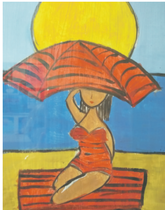
Obraz inspirowany tematyką wakacyjną, malowany z uczniami.

swojego życia mieszkała w Hiszpanii. Doskonale zna język hiszpański, kocha też podróże. Jako młoda dziewczyna autostopem zwiedziła niemalże całą Europę. Po raz pierwszy do Hiszpanii także wybrała się stopem, z mapą Półwyspu Iberyjskiego, wyciętą z... „Gazety Wyborczej”. Dość dobrze poznała ten kraj, jest zafascynowana jego kulturą i przede wszystkim ludźmi – otwartymi, przyjaznymi i niezwykle radosnymi. Dlatego również Hiszpanie,