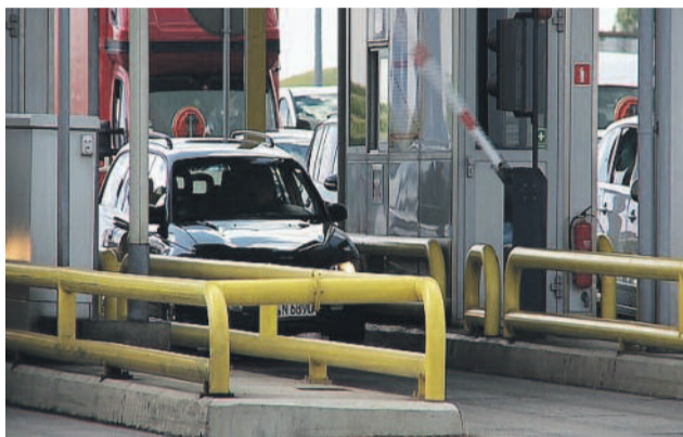
Malutkie urządzenie bardzo ułatwia pokonywanie bramek na autostradzie.

UWAGA! Samo urządzenie viaAUTO będzie wydawane przez Powiat Gliwicki bezpłatnie. Jednak aby móc przejechać przez bramkę, musimy każdorazowo na koncie urządzenia posiadać środki w minimalnej wysokości 20 zł. Jeżeli środki