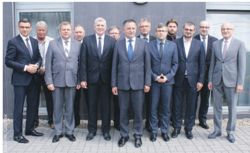
W Rudzińcu towarzyszył nam również wojewoda śląski Jarosław Wieczorek.