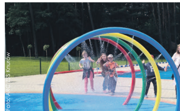
Kąpielisko jest super! – mówili uczniowie.

Spotkanie z ratownikami WOPR było dopełnieniem realizowanego od 2014 r. w ZSS w Knurowie programu profilaktycznego „Bezpieczna Szkoła”. Uczniowie dowiedzieli się, jak należy zachować się w sytuacji zagrożenia w wodzie, swojego lub innych osób, chętnie zada-