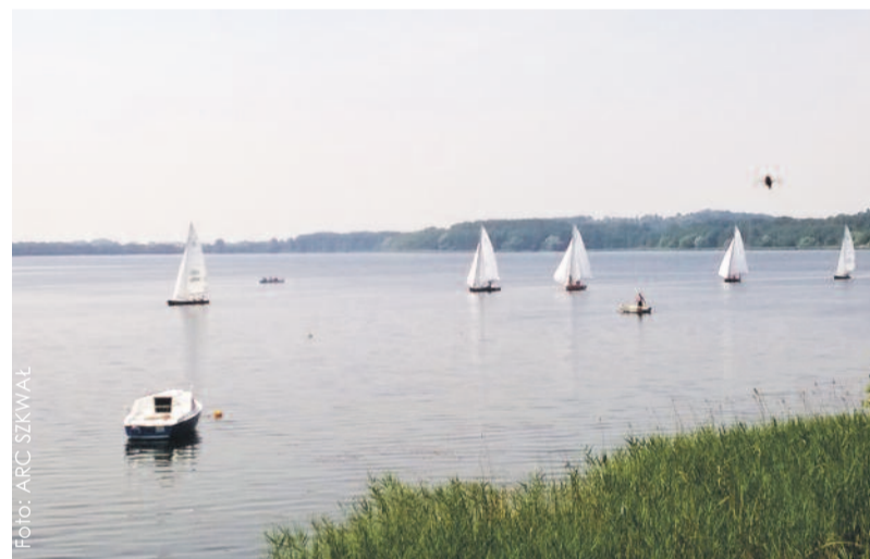
Zalew Pławniowicki to świetne miejsce do żeglowania.

Stowarzyszenie Żeglarskie SZKWAŁ oprócz organizacji regat