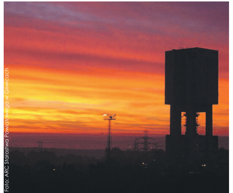
Nad Knurówem górują kopalniane szyby.

Dzisiaj to jest miejsce pełne barw jak w tęczy,