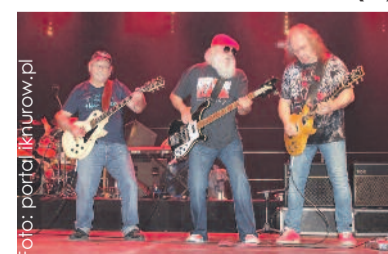
Najliczniejsze grono fanów z całego regionu przybyło na koncert legendarnej już grupy Dżem.