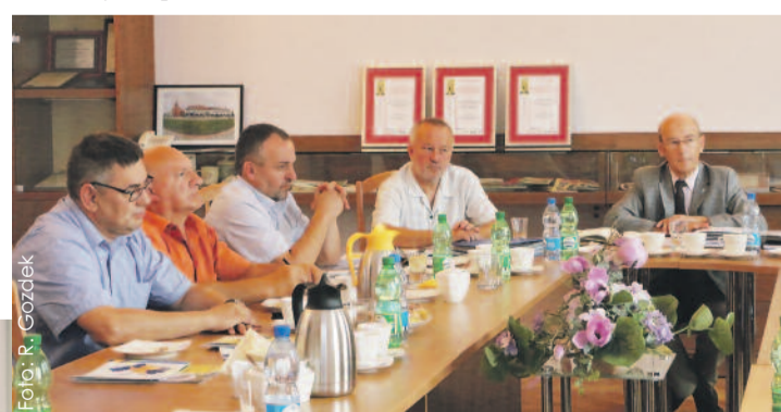
Na połączonym posiedzeniu komisji omawiano m.in. sprawy budżetowe, oświatowe i planowane przedsięwzięcia unijne.