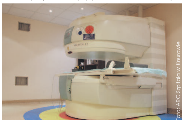
Urządzenie do wykonywania badania w Szpitalu w Knurowie.