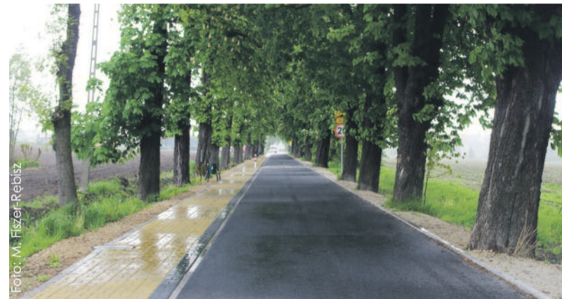
! miejsce w konkursie zajęta cudna aleja kasztanowa w Kuźni Nieborowskiej i plany jej uatrakcyjnienia.

Konkurs „Powiat Przyjazny Środowisku” na stałe wpisał się już w zielony krajobraz naszego powiatu. W ramach tegorocznej edycji zgłoszone zostały 22 wnioski z 7 gmin, w tym: z gminy Gierałtówice – 2, z gminy Pilchowice – 3, z gminy Pyskowice – 2, z gminy Rudziniec – 5, z gminy Sośnicowice – 2, z gminy Toszek – 5, z gminy Wielowieś – 3.