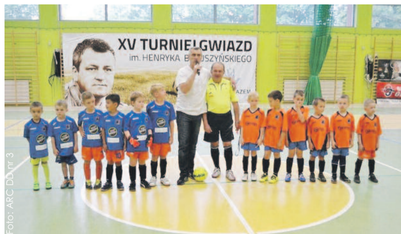
Nad boiskiem górował baner z portretem wielkiego przyjaciela dzieci, reprezentanta Polski, nieodżałowanego piłkarza...

Organizatorami turnieju byli: Dom Dziecka nr 3 w Gliwicach, Fundacja Gramy Razem, Atheneum Group, Media 360 Group, Gliwickie Stowarzyszenie Futsalu oraz Stowarzyszenie Sportowo-Edukacyjne „FeByS”. Turniej odbywał się pod honorowym patronatem starosty gliwickiego. (RG)