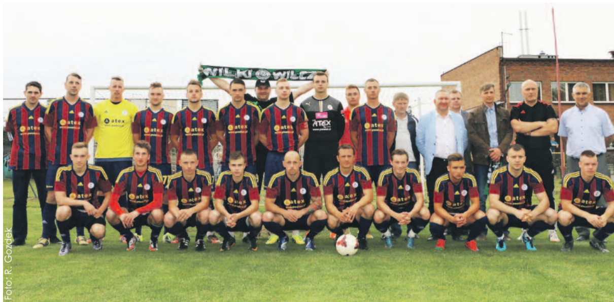
Pamiątkowe zdjęcie „Wilków” i działaczy klubu na stadionie w Jejkowicach, gdzie piłkarze wywalczyli awans do IV ligi.