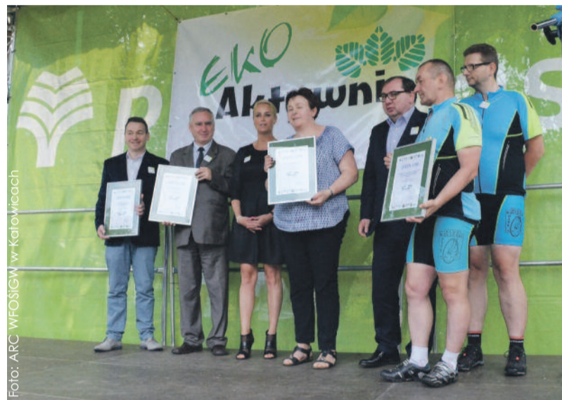
Od prawej – przedstawiciele Turystycznego Klubu Kolarskiego im. Władysława Huzy tuż po odebraniu wyróżnienia.

Wśród wyróżnionych – poza wspomnianym klubem kolarskim – znaleźli