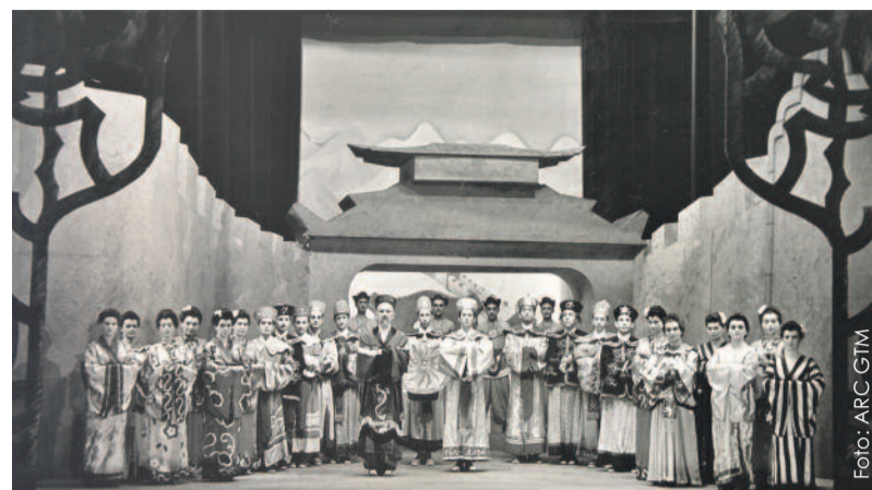
Na wystawie można zobaczyć tak cenne pamiątki, jak np. zdjęcia z pierwszego przedstawienia Państwowej Operetki w Gliwicach przy Państwowej Operze Śląskiej w Bytomiu z 1952 r. – „Krainy uśmiechu” Franza Lehara.

- Pomysł zorganizowania wystawy poświęconej dziejom sceny muzycznej