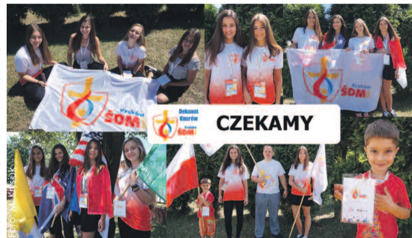
Cały Knurów cieszy się na powitanie pielgrzymów, którzy przybędą do nas na Światowe Dni Młodzieży.

Całodzienna Adoracja Najświętszego Sakramentu w kościele MB Częstochowskiej; strefy miłosierdzia i ewangelizacji (ul. Szpitalna; Plac Merkury) 10.15 – przyjazd grup międzynarodowych, Plac 700-lecia w Knurowie 10.30 – powitanie na placu kościelnym przez Orkiestrę Dętą KWK „Knurów Szczygłowice” 11.00 – uroczysta międzynarodowa msza św. pontyfikalna z udziałem grup ŚDM oraz mieszkańców dekanatu Knurów