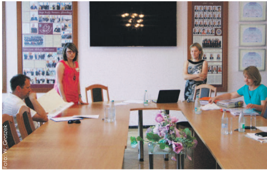
Podczas spotkania w starostwie przedstawiciele stowarzyszeń mogli wyjaśnić wszelkie wątpliwości związane z nowymi przepisami.