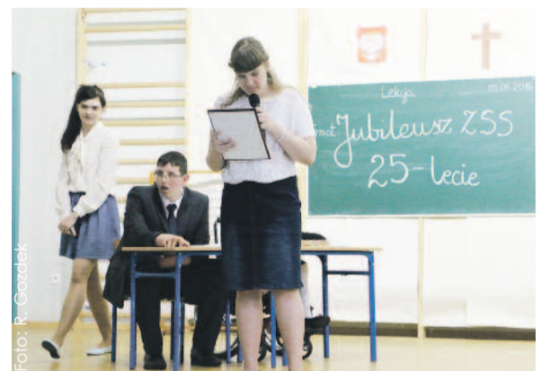
Uczniowie przypominali historię szkoły w przedstawieniu nawiązującym do programu „Sensacje XX wieku”.

Przysposabiająca do Pracy. Od 2015 r. działa tu również Wczesne Wspomaganie Rozwoju Dzieci.