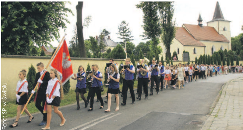
Ważnym elementem uroczystości było nadanie sztandaru – na zdjęciu społeczność szkolna podczas przemarszu z kościoła do szkoły.