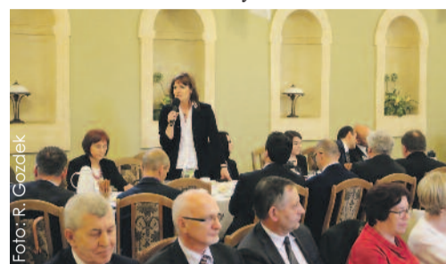
Na konwencie w Toszku z uwagą wysłuchaliśmy m.in. przedstawicieli Ministerstwa Edukacji Narodowej