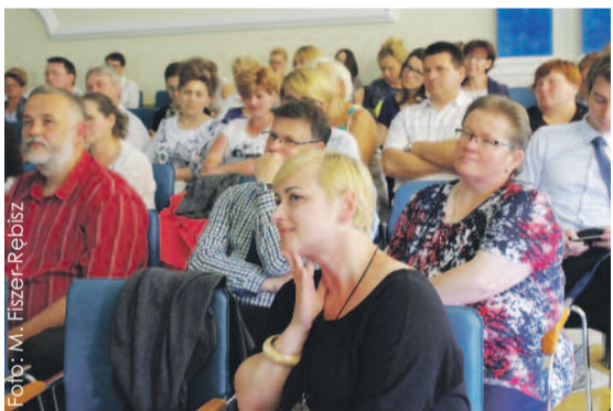
Konferencja cieszyła się dużym zainteresowaniem – zarówno rodziców zastępczych, jak i osób, które ich wspierają.

- Chcieliśmy oddać głos rodzicom zastępczym. Zależało nam na wymianie