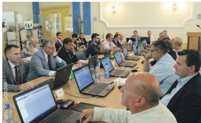
Podczas czerwcowej sesji Rady Powiatu Gliwickiego.