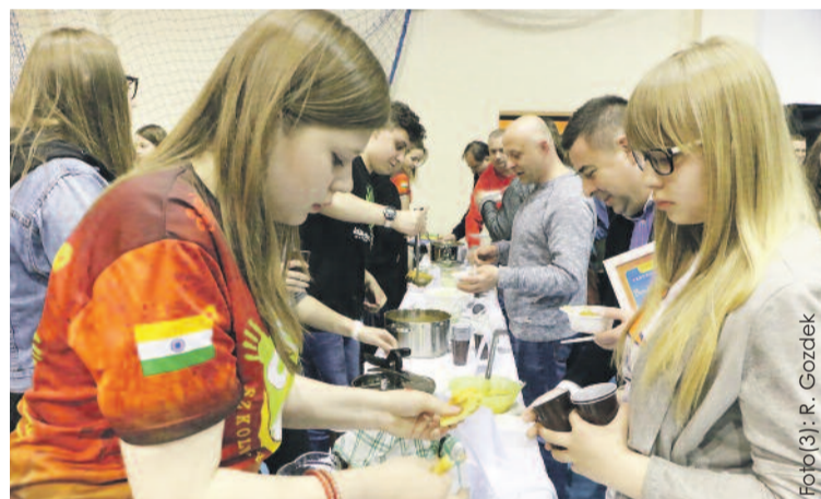
Każdy chciał skosztować, jak smakują indyjskie potrawy.