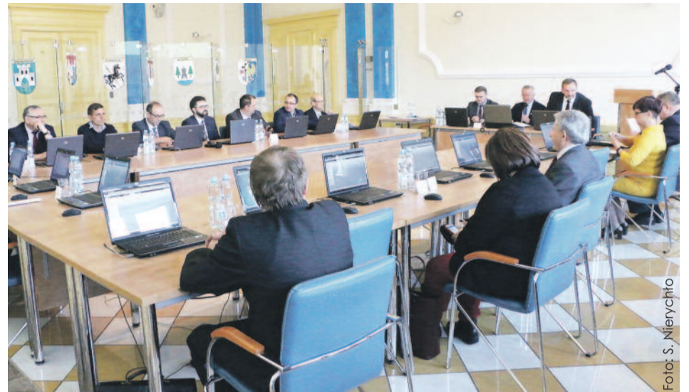
Podczas marcowej sesji Rady Powiatu Gliwickiego.