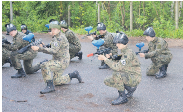
Uczniowie klasy mundurowej LO w Zespole Szkół im. M. Konopnickiej podczas ćwiczeń na poligonie.

ta ta zaprezentowana zostanie na III Powiatowym Festiwalu Zawodów, który odbędzie się 26 kwietnia w godz.