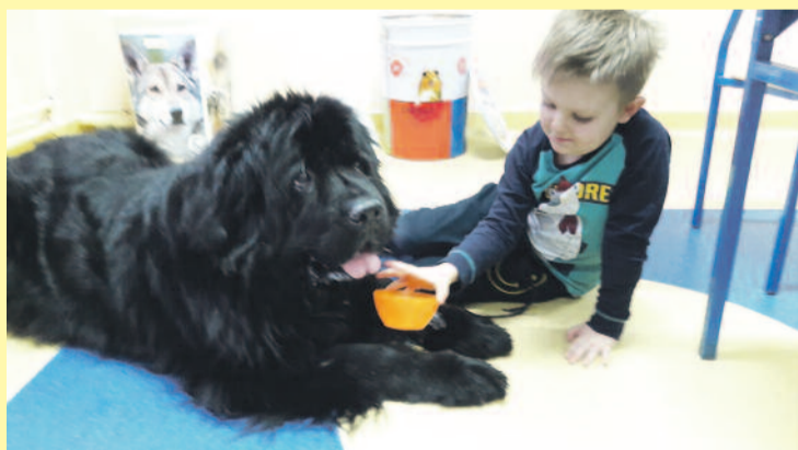
Dogoterapia daje bardzo dobre rezultaty, a dzieci ją uwielbiają.

Uczniowie korzystają z darmowych przejazdów komunikacją miejską, w szczególnych przypadkach z takiej ulgi