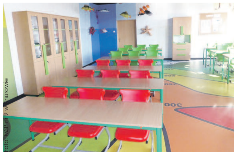
W ub. roku jedna z Zielonych Pracowni powstała m.in. w Miejskiej Szkole Podstawowej nr 9 w Knurowie, teraz dofinansowanie trafiło do następnych placówek na naszym terenie.

micznie-fizycznych. Laureaci otrzymali nagrody pieniężne na wdrożenie nagrodzonego projektu ekopracowni w roku szkolnym 2018/2019, a pla-