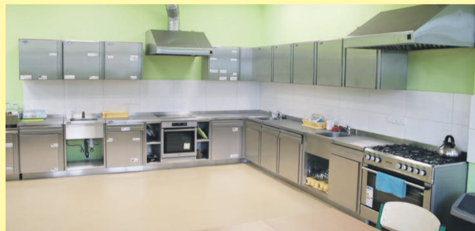
Jedną z niedawno oddanych do użytku pracowni umożliwiają zdobywanie umiejętności kucharzskich na najwyższym poziomie.

Od marca tego roku w szkole funkcjonuje winda osobowa dla uczniów mających trudności w przemieszczaniu się pomiędzy kondygnacjami budynku. Otwarto także nowoczesne pomieszczenia