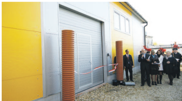
Nowoczesna Stacja Uzdatniania Wody w Nieborowicach (gm. Pilchowice), oddana do użytku w 2014 r., także otrzymała wsparcie finansowe WFOŚiGW w Katowicach.