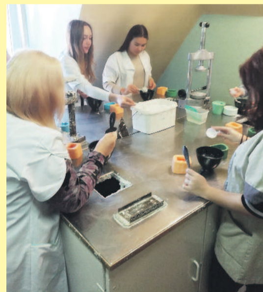
Zajęcia w klasie medyczno-kosmetycznej zapewniają zdobycie wielu praktycznych umiejętności.