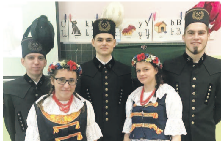
Zespół Szkół Zawodowych nr 2 w Knurowie szkoli przyszłych górników, zapewniając uczniom stypendia i pracę w kopalni po ukończeniu nauki.

na zarówno zdobyć dobry zawód, jak się tu anonimowo, nie giną w tłumie, a są traktowani z należytą uwagą i szacunkiem dla ich indywidualności. Nasze zespoły szkół są blisko Was – rów-