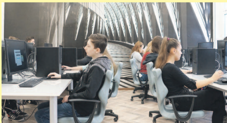
Zajęcia w jednej z nowoczesnych pracowni informatycznych Technikum nr 1.