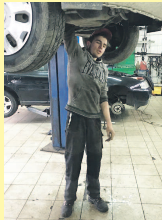
W Zespole Szkół Zawodowych nr 2 w Knurowie można zdobyć naprawdę dobry zawód, m.in. mechanika.

Szkoła jest również ośrodkiem egzaminacyjnym w kwalifikacjach zawodowych. Dla uczniów rozpoczynających naukę w roku szkolnym 2018/2019 w Branżowej Szkole I stopnia w zawodach: elektryk, ślusarz, mechanik-monter maszyn i urządzeń, szkoła oferuje gwarancję zatrudnienia w kopalniach Jastrzębskiej Spółki Węglowej S.A.