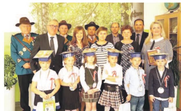
Wiele z przedsięwzięć stowarzyszenia związanych jest ze Szkołą Podstawową w Chechle.