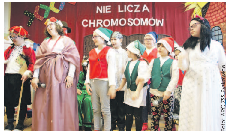
Uczniowie przygotowali dla gości piękne przedstawienie.