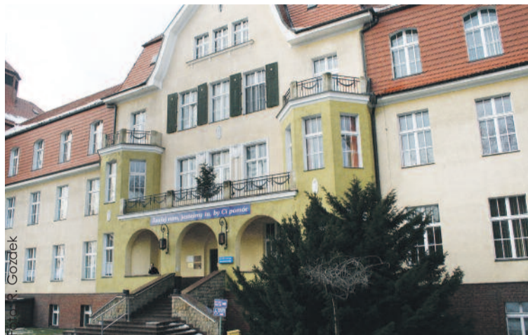
Fundusz wsparł m.in. termomodernizację Szpitala w Knurowie, dofinansowując wymianę stolarki okiennej w jego budynku głównym.