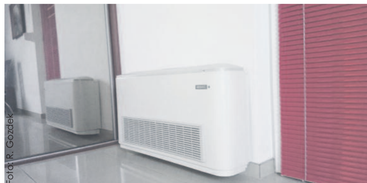
Na targach będzie można zapoznać się z szeroką ofertą nowoczesnych źródeł ogrzewania, m.in. pomp ciepła, które nie tylko ogrzewają dom, ale i zapewniają jego klimatyzację.