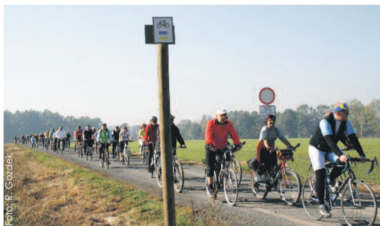
W powiecie gliwickim mamy świetne trasy rowerowe. Warto zaplanować sobie po nich przejażdżkę i oczywiście pamiętać, aby przed wyruszeniem w drogę sprawdzić stan swojego roweru.

– z tyłu – co najmniej jedno światło odblaskowe barwy czerwonej o kształcie innym niż trójkąt oraz co najmniej jedno światło pozycyjne barwy czerwonej,