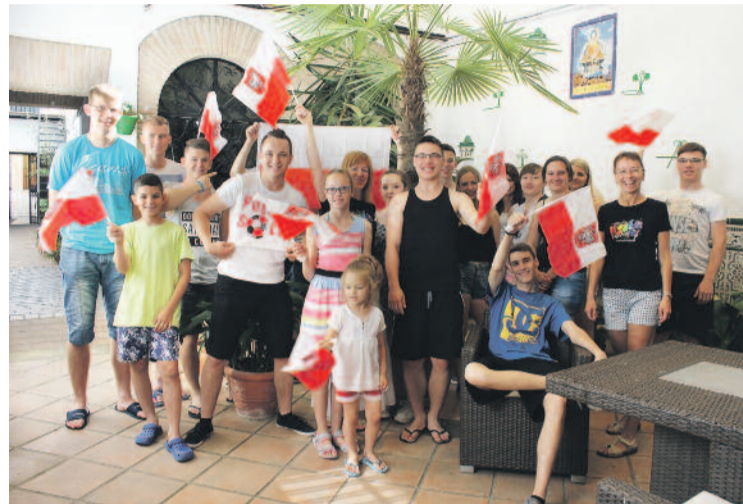
Technikum w „Paderku” umożliwiła odbywanie zagranicznych staży zawodowych – na zdjęciu ich uczestnicy podczas pobytu w Hiszpanii.

8.00-13.00 w ZSZ nr 2 w Knurowie. Zapraszamy m.in. na pokazy umiejętności zawodowych uczniów, prezen-