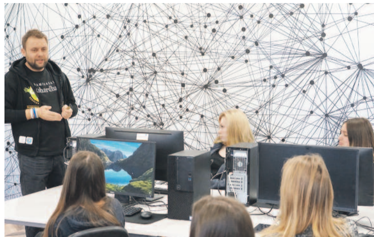
Zajęcia w jednej z nowoczesnych pracowni informatycznych Zespołu Szkół im. I. J. Paderewskiego w Knurowie.

dycznego w Zespole Szkół Zawodowych nr 2 w Knurowie, gdzie wróci też technik górnictwa podziemnego. Ofer-