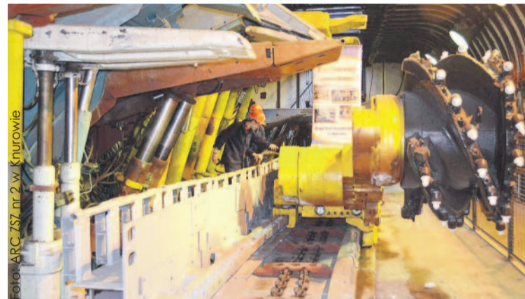
W Zespole Szkół Zawodowych nr 2 w Knurowie można w praktyczny sposób uczyć się zawodów przydatnych w górnictwie – z gwarancją pracy w kopalni i prawem do stypendium.

Wypłacając stypendia, JSW stawia jednak pewne warunki. I tak niezaliczenie roku wiąże się z przysięgą zwrotu stypendium. Ponadto do otrzymania go uprawnieni będą ci uczniowie, którzy w miesiącu, za który przyznawane jest stypendium, nie mieli żadnej nieusprawiedliwionej nieobecności. Absolwenci objęci programem stypendialnym zobowiązani