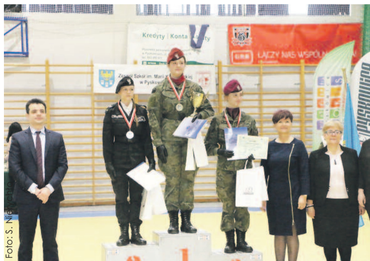
Na podium zwycięzcy jednej z konkurencji – najlepsze kadetki.

Górnym, Zespół Szkół Ekonomiczno-Technicznych im. Cichociemnych w Gliwicach – klasa wojskowa i klasa policyjna, XIV Liceum Ogólnokształcące im. mjr. Henryka Sucharskiego w Katowicach, Państwowe Szkoły Budownictwa Zespół Szkół