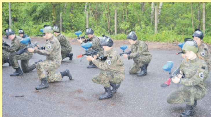
Klasa mundurowa w Liceum Ogólnokształcącym „Konopnickiej” daje świetne przygotowanie do pracy m.in. w wojsku, policji czy straży pożarnej.