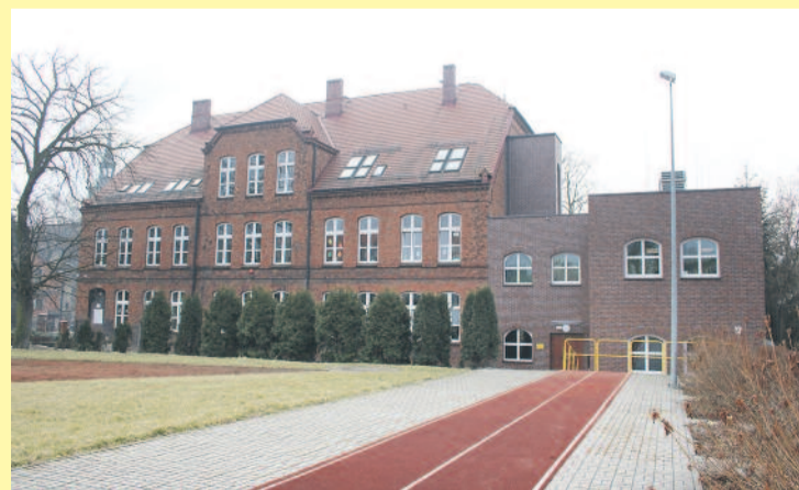
Budynek szkoły łączy tradycję z nowoczesnością – choć wiekowy, właśnie wzbogacił się m.in. o windę, ma też piękne otoczenie i warunki do uprawiania sportu.

Zapraszamy wszystkich do odwiedzenia Zespołu Szkół Specjalnych w Pyskowicach!