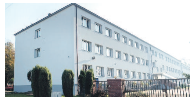
Ośrodek znany jest z wszechstronnej działalności na rzecz osób potrzebujących wsparcia.

Ośrodek, poza prowadzeniem bardzo rozległej działalności statutowej, jest również miejscem tworzącym społeczność osób z niepełnościami poprzez liczne podejmowane działania artystyczno-sportowe, co sprzyja też integracji z mieszkańcami Knurowa i powiatu.