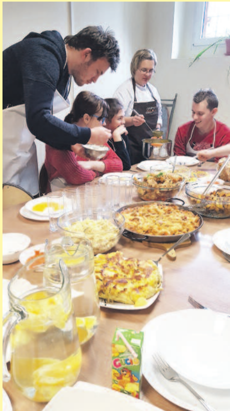
Uczniowie na zajęciach z zakresu żywienia przygotowują prawdziwe pyszności.

W skład Zespołu Szkół Specjalnych wchodzi: