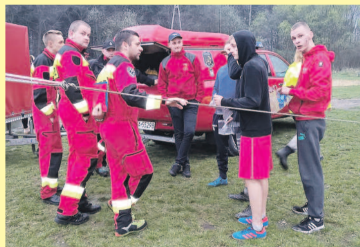
Ratownictwo medyczne to nowa propozycja w tutejszym Liceum Ogólnokształcącym.

Kosmetyka i wizaż to projekt rozwijający zainteresowania usługami kosmetycznymi. Oprócz przedmiotów ogólnokształcących, uczniowie mogą poszerzać swoją wiedzę z zakresu pielęgnacji ciała oraz odbywać praktykę w salonach kosmetycznych. Przedmiotami uzupełniającymi są