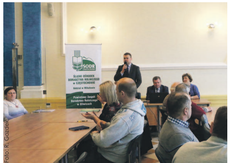
Podczas spotkania na temat zmian w składaniu wniosków do ARiMR.