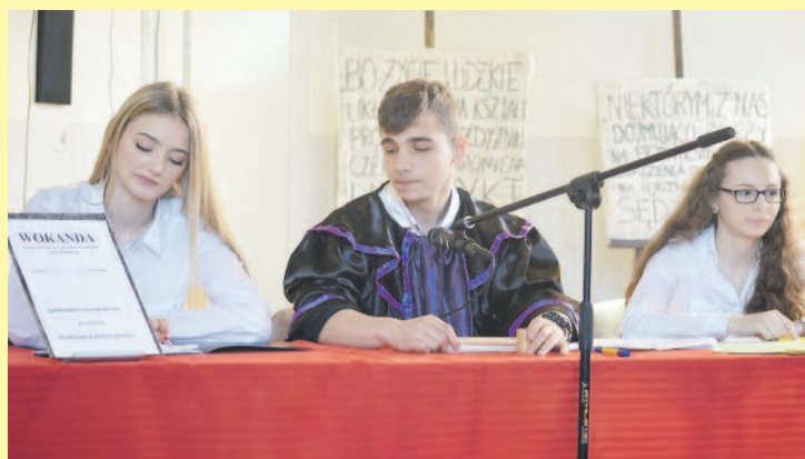
Już w szkole jest możliwość wcielenia się w rolę sędziego, prokuratora, adwokata lub radcy prawnego.