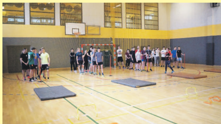
„Paderewski” dysponuje świetnym zapleczem sportowym.