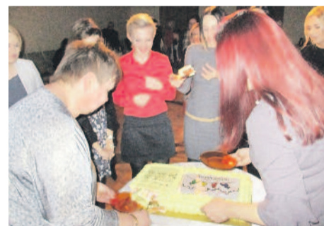
Ludzie Miasta niedawno obchodzili 5-lecie, ale ich działalność jest tak intensywna, że zdaje się, iż trwa już o wiele, wiele dłużej.

Integruje, aktywizuje i edukuje mieszkańców, organizuje szereg akcji społecznych, charytatywnych oraz kulturalnych na rzecz gminy i powiatu. Zostało założone w 2012 r. i od tej pory skutecznie zaprasza wszystkich chętnych do realizacji swych licznych pomysłów. Do jego najbardziej popularnych działań można zaliczyć np. Ogólnopolskie Spotkania Taneczne „Płyś Dramy”, warsztaty artystyczne, Klub MAMCzas, Wyprzedaże Garażowe, „Zamieniady”, sadzenie krokusów w miejskich parkach, wystawy, rajdy historyczne po Pyskowicach i okolicy, Bieg Rodzin czy Pyskowicki Dzień Zwierzaka. Do tej pory stowarzyszenie pozyskało ponad 52,5 tys. zł dotacji z różnych źródeł, przeznaczając je na akcje, szkolenia, w a r s z t a t y i konkursy dla mieszkańców. Jego członkowie są wszędzie, zarażają pyskowiczana swą aktywnością i pozytywnym myśleniem.