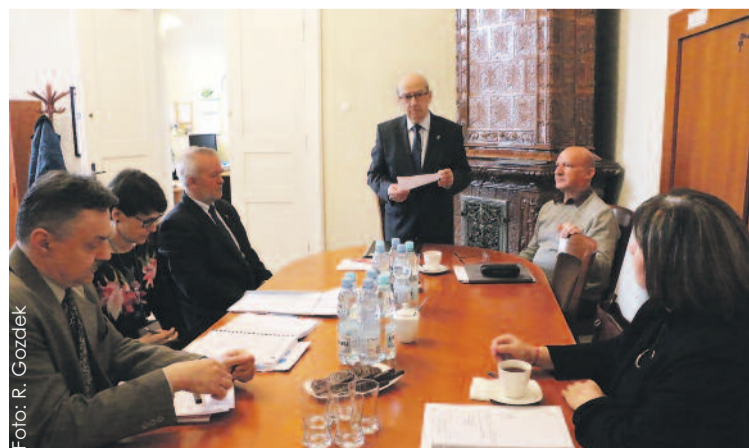
Komisja Ochrony Środowiska, Rozwoju i Promocji na swym marcowym posiedzeniu.

roli, bowiem jednym z zagadnień, którym się zajmowali, było wydawanie i tematyka „Wiadomości Powiatu Gliwickiego” w minionym roku. Drugim wiodącym tematem posiedzenia było zapoznanie się z informacją na temat zanieczyszczenia gleb, wód i powietrza w różnych częściach naszego powiatu.