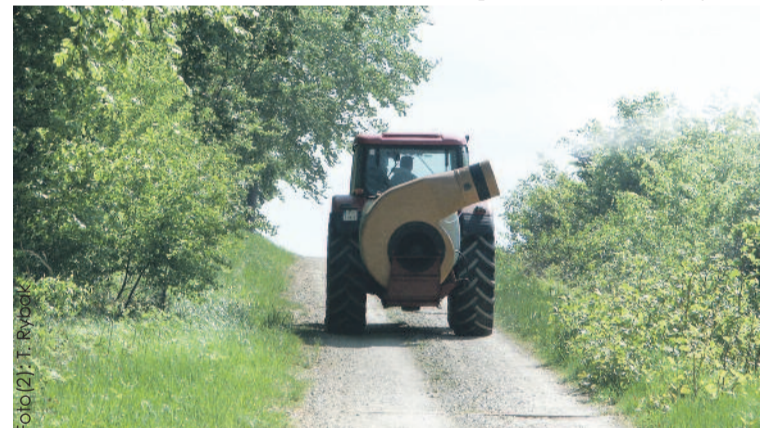
Opryski prowadzone będą zarówno przy użyciu sprzętu naziemnego, jak i agrolotniczego.

Taka mała dawka preparatu na 1 hektar powierzchni zatrzymuje się