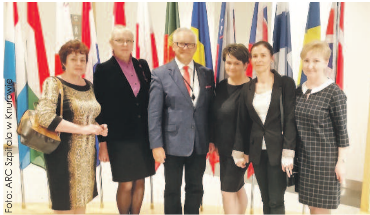
Uczestniczki wyjazdu studyjnego w Parlamencie Europejskim z Bolesławem Piechą.

W trakcie spotkania w Parlamencie Europejskim omówione zostały naj-