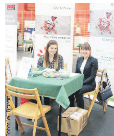
Co roku na targach znaleźć można wiele ofert pracy.

Targi odbędą się w Hali Widowiskowo-Sportowej „Górnych Wałów” w Gliwicach przy ul. Górnych Wałów 29. Trwać będą od godz. 10.00 do 13.00.