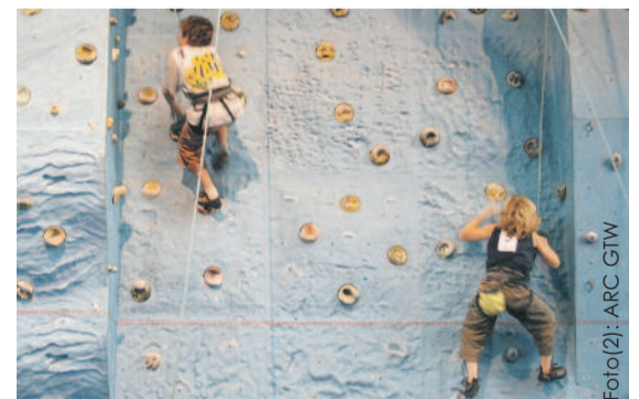
W hali ZSP w Gierałtowicach są świetne warunki do trenowania wspinaczki.

się w godz. 14.30-16.00 (dwie grupy po 45 min), a dziewczęta w wieku 8-10 lat o godz. 16.00. Oprócz treningów organizowane są wyjazdy,