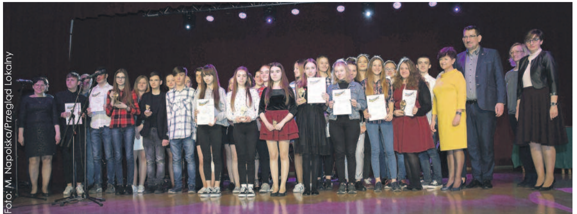
Konkurs skupił wielu uzdolnionych gimnazjalistów z terenu całego naszego województwa.

Wielu pięknych utworów w bardzo dobrym wykonaniu można było wysłuchać na koncercie galowym podsumowującym XV Wojewódzki Konkurs Piosenki Młodzieżowej „Droga do gwiazd przez gimnazjum”, który odbył się 6 kwietnia w Domu Kultury w Knurowie-Szczygłowicach.