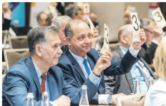
Przyjęliśmy 8 stanowisk w ważnych sprawach powiatowych.