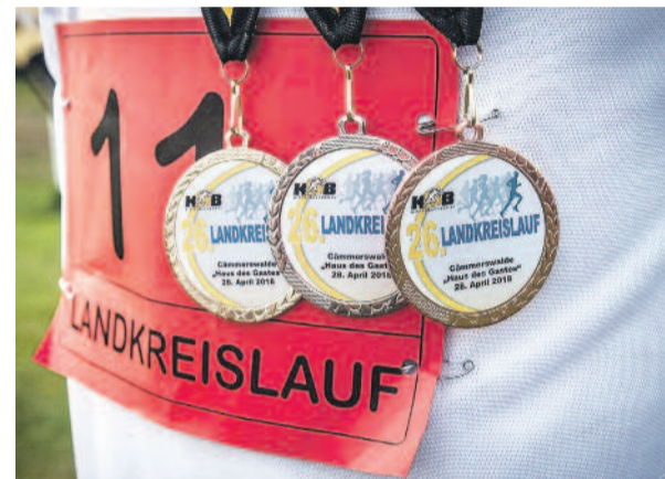
Na piersiach naszych młodych zawodników zawisły aż trzy medale.

– Biorąc udział w tym wspaniałym wydarzeniu sportowym, gdzie dobra zabawa wysuwa się na pierwszy plan przed sportową rywalizacją, możemy zaobserwować, jak nasze partnerstwo żyje, a ludzi, których dzielą kilometry i nieraz bariera językowa, jednoczy wspólna pasja: bie-