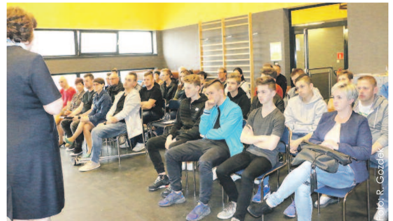
Młodzież z uwagą słuchała, jakie będą możliwości łączenia nauki z uprawianiem sportu.