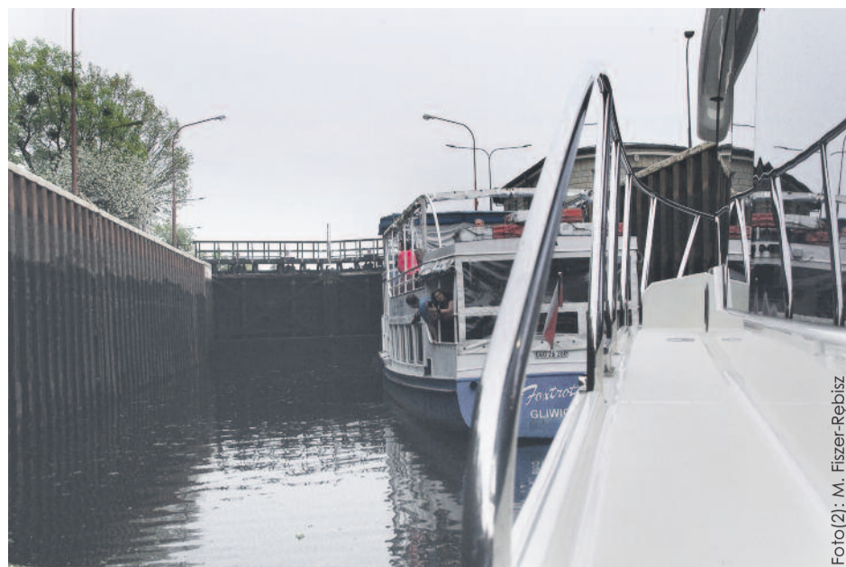
Zarówno Foxtrot, jak i Nautica świetnie radzą sobie z pokonaniem śluz na Kanale Gliwickim.