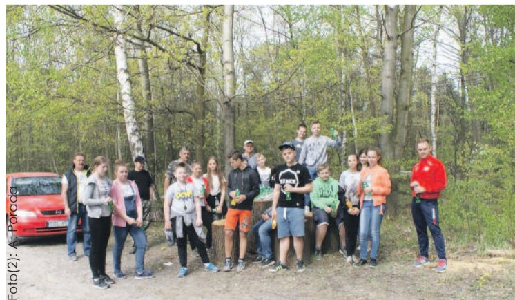
Uczniowie MSP nr 3 w Knurowie zadbali o czystość przy stawie Zacisze.