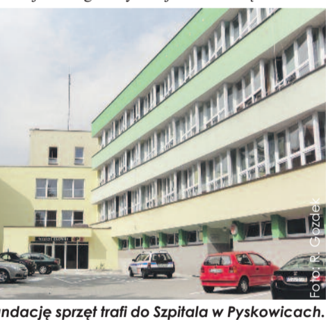
Zakupiony przez fundację sprzęt trafi do Szpitala w Pyskowicach.

bierają go jako miejsce porodu. Rodzą tu kobiety nie tylko z Pyskowic i sąsiednich miejscowości, ale również z bardziej odległych stron kraju i z zagranicy. Pacjentki chwalą oddział za