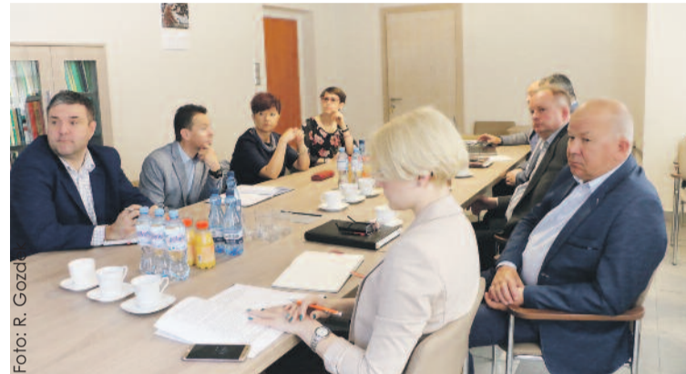
Podczas spotkania w siedzibie JSW Szkolenie i Górnictwo.