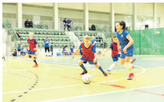
Dziewczęta sprawują się na boisku równie dobrze jak chłopcy.

się również w hali Zespołu Szkolno-Przedszkolnego w Gierałtowicach. Organizowane są w środy. Przedszkolaki w wieku 4-6 lat