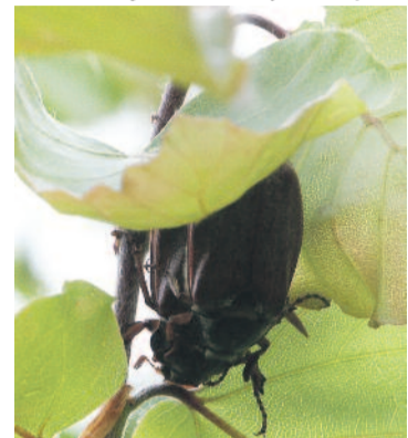
Chrabąszcz na wielką skalę zjada liście i igły, niszcząc drzewa.

Wykorzystując rok masowej rójki, przystępujemy do zwalczania owadów doskonałych. Nadleśnictwo Rudziniec w maju br. dokonywać będzie