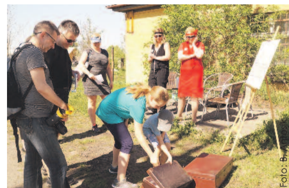
Pyskowiczanie mieli okazję przenieść się w lata 20. minionego wieku.

– Zachęceni wspaniałą frekwencją, mamy nadzieję, że kolejna edycja, z nowymi zadaniami, odbędzie się za rok. Natomiast już 13 maja organizujemy kolejne wydarzenie dla rodzin z dziećmi pod hasłem „Stacja Zaba-