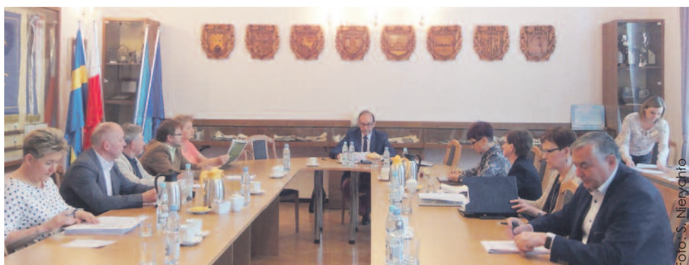
Podczas posiedzenia Komisji Zdrowia.