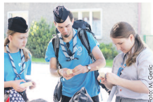
Uczestnicy rajdu musieli wykonać szereg trudnych zadań, by dotrzeć do celu.