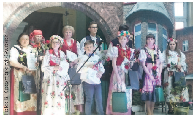
Zwycięzcy konkursu gwarowego zaprezentowali się w pięknych śląskich strojach regionalnych.

Doskonale wypadli mieszkańcy powiatu gliwickiego w dwóch konkursach regionalnych Fundacji Lokalna Grupa Działania Spichlerz Górnego Śląska: gwarowym – „Godomy po naszymu” i kulinarnym – „Spichlerzowe Danie Roku”.