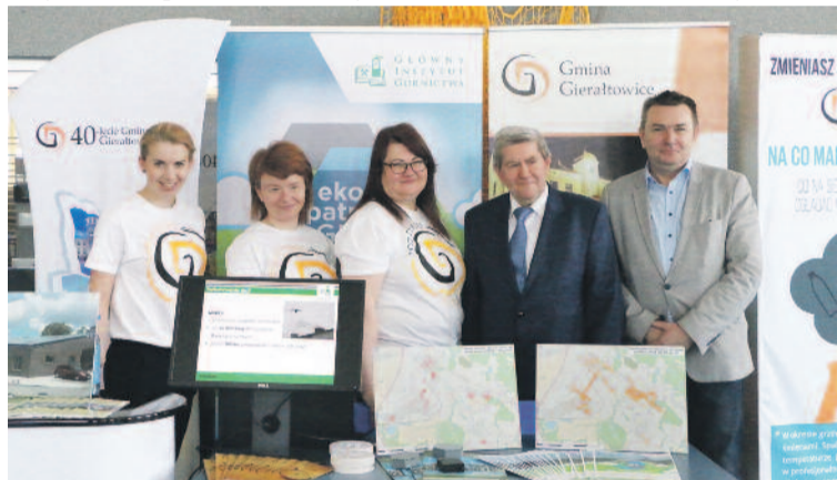
Swymi doświadczeniami w zwalczaniu smogu dzieliła się m.in. Gmina Gierałtowiec.

tory, stolarkę okienną i oświetlenie ledowe, nie zabrakło też ciekawej propozycji motoryzacyjnej, promującej samochody zasilane energią elektryczną. Stoiska miały również Urząd Marszałkowski Województwa Śląskiego, Powiat Gliwicki i samorządy Knurowa, Gierałtowiec oraz Pilchowic, za-