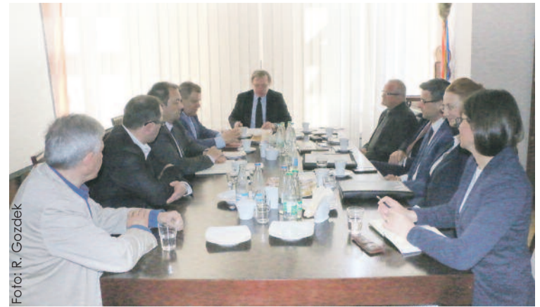
Podczas spotkania w starostwie.

Pierwsze z nich to budowa obwodnicy wokół Sośnicowic, która ma