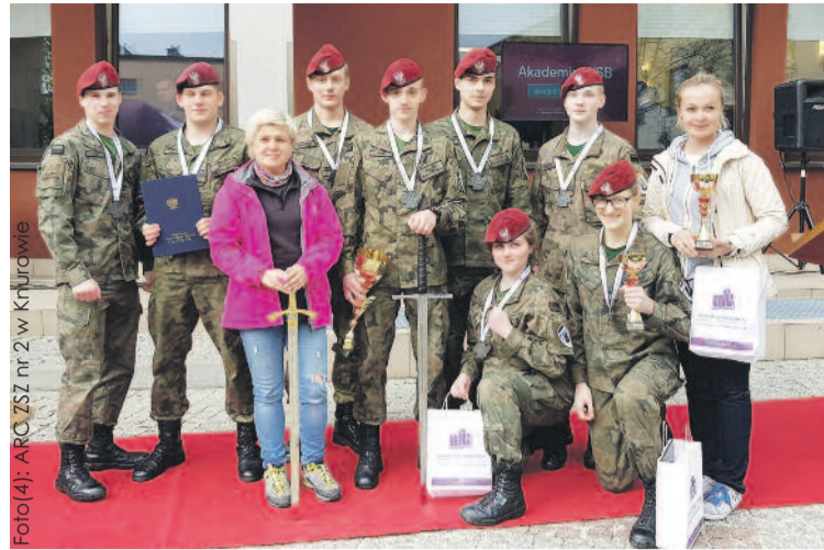
Zwycięska reprezentacja Zespołu Szkół Zawodowych nr 2 w Knurowie.

i srebro w tym prestiżowym turnieju. Z tegorocznej edycji, która odbywała się 16-17 kwietnia w Dąbrowie Górniczej i Siemianowicach Śląskich,