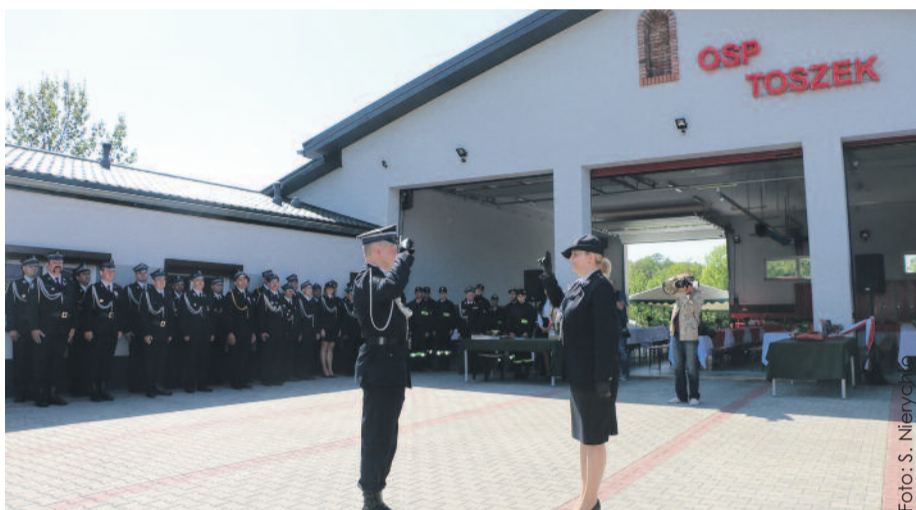
Uroczystość przed nowo oddaną do użytku siedzibą toszeckiej OSP.