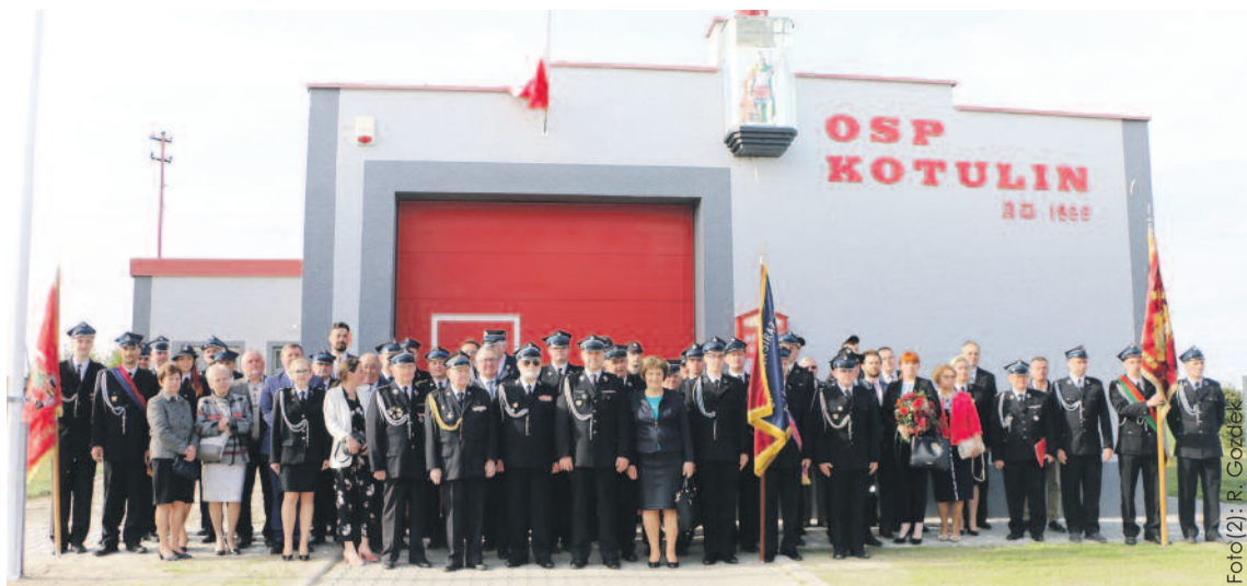
Druhom z Kotulina w jubileuszowych obchodach towarzyszyło wielu znamienitych gości.