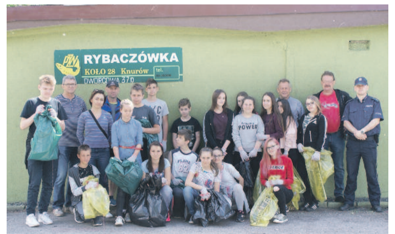
Taka ekipa uprzątnęła teren wokół zbiornika Moczury.

TRZĘCI ZAWARTE W PUBLIKACJI NIE STANOWIĄ OFICJALNEGO STANOWISKA ORGANÓW WOJEWÓDZKIEGO FUNDUSZU OCHRONY ŚRODOWISKA I GOSPODARKI WODNEJ W KATOWICACH