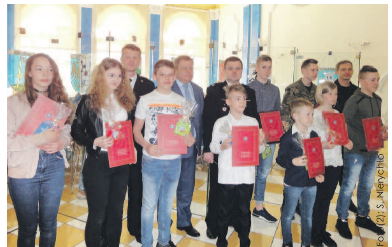
Laureaci konkursu wraz z jego organizatorami.

Uczestnicy konkursu mieli za zadanie wypełnić nietrywny test. Jego zakres tematyczny obejmował takie zagadnienia jak m.in.: przyczyny powstawania pożarów, sprzęt ratowniczo-gaśniczy, prowadzenie akcji ratowniczej, urządzenia przeciwpożarowe, zasady ewakuacji, udzielanie pierwszej pomocy przedmedycznej czy wiedza na temat podstaw funkcjonowania służb ochrony bezpieczeństwa publicznego. Aby wyłonić zwycięzców, konieczne były dogrywki.