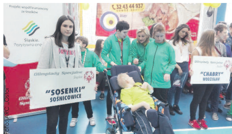
Dziewczęta z „Ostoi” polubiły sport.