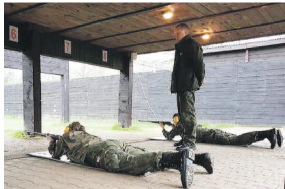
Uczniowie musieli wykazać się doskonałą sprawnością fizyczną i wieloma umiejętnościami.

W ubiegłym roku uczniowie ZSZ nr 2 w Knurowie wywalczyli złoto