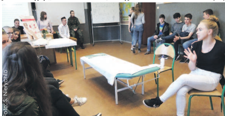
Jedną z ciekawych propozycji to projekt edukacyjny „Kosmetyka i wizaż” w II LO.