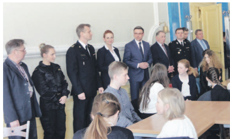
Uczniom doskonałej wiedzy gratulowali m.in. strażacy, starosta i włodarze ich gmin.

Laureaci w poszczególnych grupach wiekowych w nagrodę otrzy-