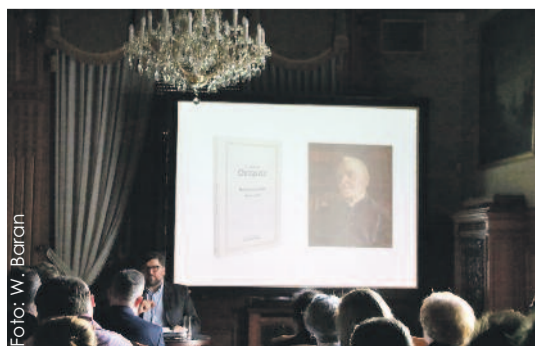
Wernisaż wystawy odbył się 20 kwietnia.