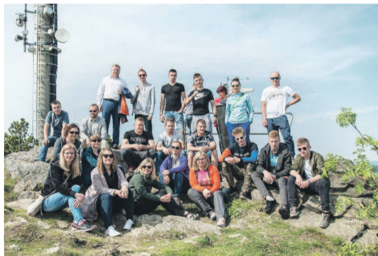
Jak zawsze była okazja, by bliżej poznać uroki powiatu Mittelsachsen.