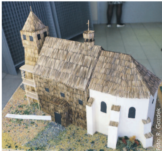
Wśród prac dominowały rysunki, ale nie zabrakło też pięknych prac przestrzennych.