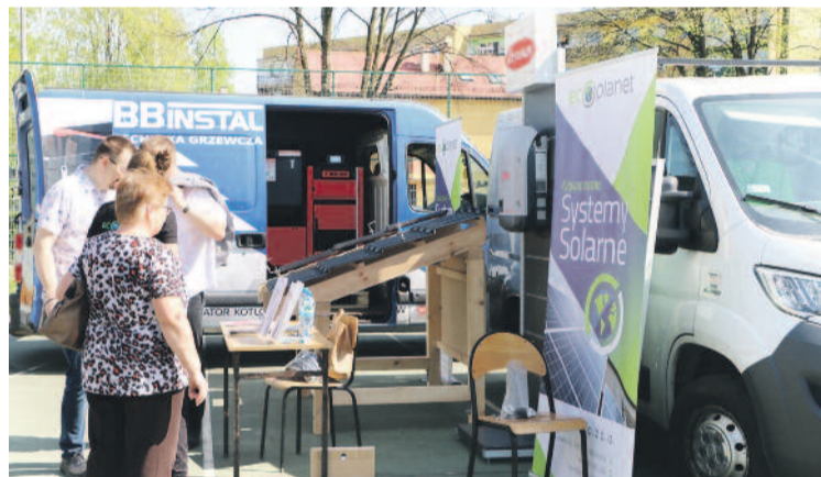
Można było zapoznać się z bogatą ofertą firm zapewniających pozyskanie ciepła i energii w sposób nieszkodzący naturze.

– Wysłuchać można było między innymi fachowców z Politechniki