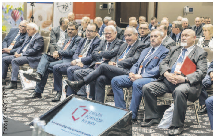
Reprezentanci powiatów w czasie obrad.

Podczas Zgromadzenia podkreślono, że funkcjonujące w obecnym kształcie powiaty mają już 20 lat. Obejrzelśmy transmisję wystąpienia Jerzego Buzka, prezesa Rady Ministrów w latach