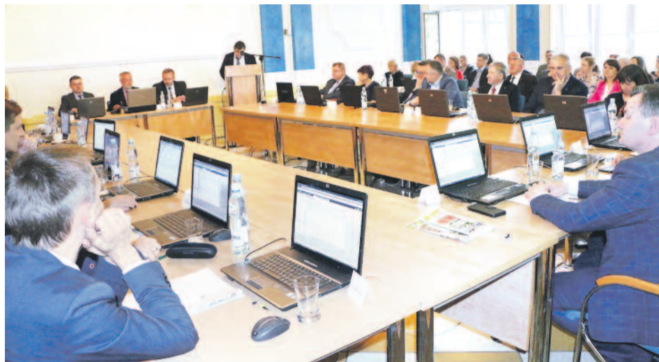
Kwietniowa sesja Rady Powiatu Gliwickiego.

konsekwencje są poważne. Powiat opracował program, który zwiększy dostępność mieszkańców do badań mających na celu wykrycie choroby. W tym roku przeznaczymy na to 30 tys. zł, w przyszłym roku – podobną kwotę. O realizacji programu i możliwości uczestnictwa w nim będziemy na bieżąco informować Czytelników „Wiadomości Powiatu Gliwickiego”.