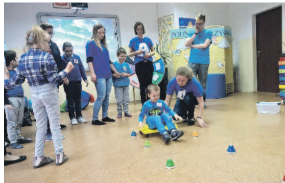
Od rana w szkole trwały wspólne zabawy.