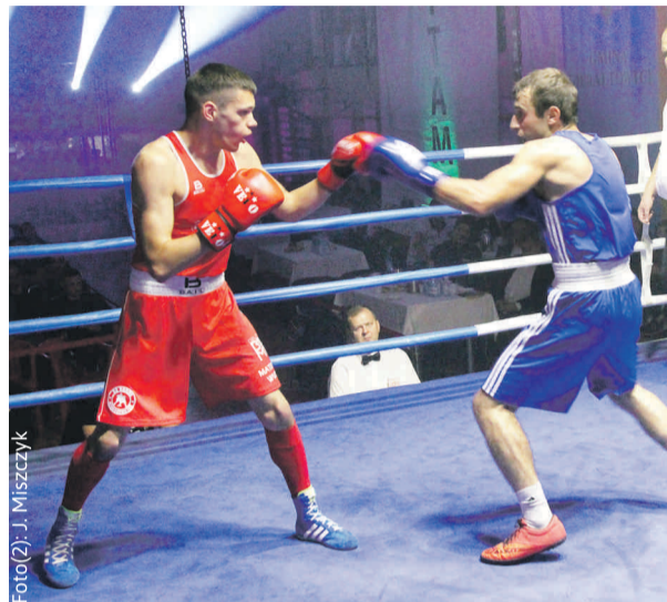
W Gieratowicach toczą się walki na najwyższym poziomie.

Walki toczono w duchu fair play i na wysokim poziomie sportowym. Zapewnili go utytułowani zawodnicy, mistrzowie