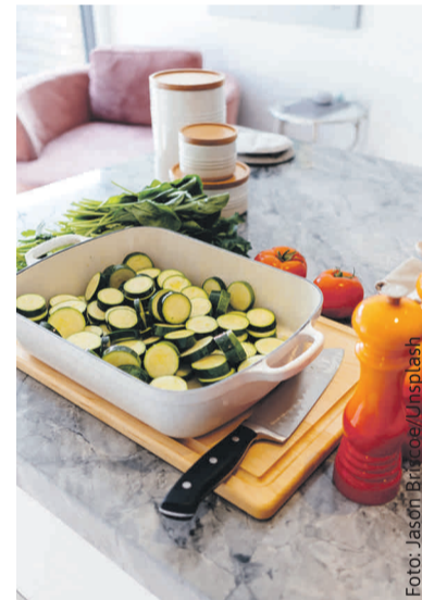
Cukinia świetnie nadaje się na zupę krem.

Wykonanie: Gotujemy bulion zalewając wodą nóżki, obrane warzywa, listek i przyprawy (ok. godziny na średnim ogniu bez przykrycia). W rondlu z gru-