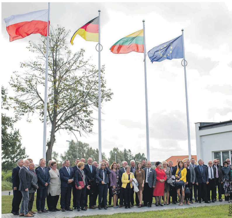
Po wciągnięciu na maszt flag UE i państw partnerskich powiatów.

II edycja Festiwalu Ryby i Wina była okazją do promocji 23 zarejestrowanych na terenie Powiatu Puckiego produktów tradycyjnych – w tym m.in. dań z ryb morskich, a także promocji win mozelskich przywiezionych z powiatu Trier-Saarburg. Nie zabrakło pokazów kulinarnych w wykonaniu mistrzów kuchni oraz potraw przygotowanych przez