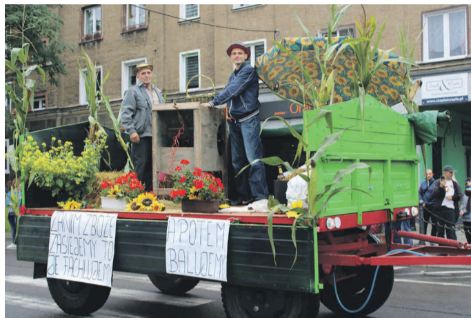
W korowodzie nie zabrakło wesołych scenek rodzajowych.