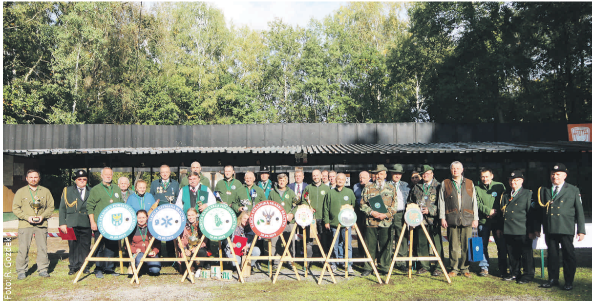
Pamiątkowe zdjęcie uczestników imprezy i sympatyków toszeckiego bractwa – na pierwszym planie tarcze, o których trofea walczone w Dzierżnie.

28 września na Strzelnicy Sportowej w Dzierżnie odbyło się Inauguracyjne Strzelanie Kurkowego Bractwa Strzeleckiego w Toszku.