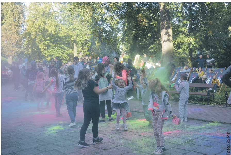
Piknik obfitował w atrakcje dla młodszych i starszych.

Program imprezy był bardzo bogaty, wypełniły go przeróżne zabawy i animacje, warsztaty relaksacyjne, teatralne, artystyczne, kosmetyczne, językowe, turniej tenisa stołowego, spotkanie z dietetykiem. Nie zabrakło atrakcji dla najmłodszych, dla pasjonatów sportu – o co zadbała Futsal Akademia Pyskowice i KS Spartan, Akademii Bezpiecznej Jazdy z Ośrodkiem Szkolenia Kierowców LEW. Czas umiliły także gry planszowe i kreatywne zabawy ze Stowarzyszeniem Stacja Pyskowice. Na chętnych czekała też fotobudka, historyczna wy-