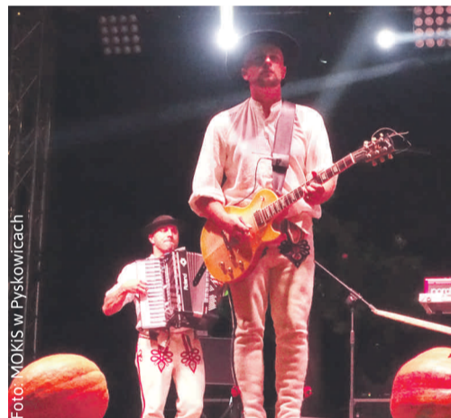
Powiatowe dożynki w Pyskowicach były także uczcą muzyczną. W sobotę na scenie pojawił się m.in. zespół Baciarzy...