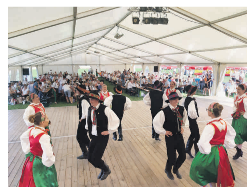
Wesoła zabawa w Wiśniczach. Materiały nadesłane przez gminy

1 września odbyły się Dożynki Gminy Wielowieś w Wiśniczach. Rozpoczęły się uroczystą mszą św. w kościele parafialnym. Następnie przeszedł barwny korowód ze scenkami rodzajowymi nawiązującymi do pracy i życia rolnika, w którym przepiękne korony dożynekowe reprezentowały jedenaście sołectw gminy. Odbyło się tradycyjne przekazanie bochna chleba przez starostów dożynekowych. Wójt Gminy Wielowieś wręczył odznaczenia „Zasłużony dla rolnictwa”. Mieszkańcy Wiśnicz udekorowali swoje posesje owocami ziemi. Niemal przy każdej bramie stała wesoła scenka, symbolizująca czas zakończenia zniw. W części biesiadnej wystąpili: Krzysztof Respondek, Zespół Pieśni i Tańca „Miedzarzanie” oraz Parafialna Orkiestra Dęta z Wiśnicz, która obchodziła swoje 5-lecie działalności. Biesiadowanie zakończyła zabawa taneczna z zespołem DEWERS. Zaangażowanie sołectwa we wspólną inicjatywę było okazją do integracji społeczności lokalnej.