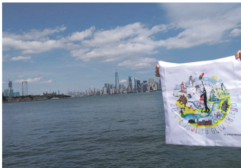
Torba Powiatu Gliwickiego na tle Manhattanu...

Nie inaczej było w Waszyngtonie, gdzie pod Białym Domem (obecnie trwa remont ogrodzenia domu prezydenta Donalda Trumpa), czy Capitołem (siedzibą m.in. rządu i senatu USA), w czasie gdy próbowaliśmy „ustawić” do zdjęcia naszą torbę reklamową, widzieliśmy ewidentne