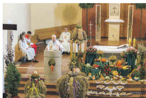
Podczas mszy św. dziękczynnej w Chudowie.