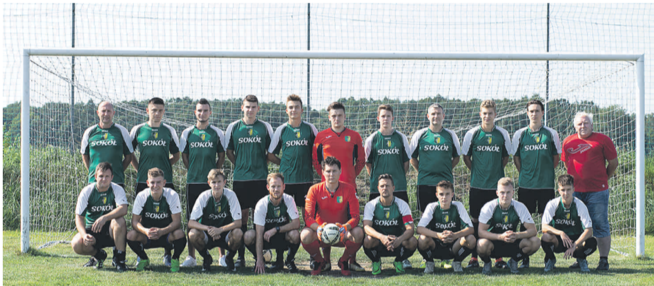
Reprezentacja KS Sokół w sezonie 2019-2020.

Klub istnieje od roku 1979, w tym roku obchodzi swoje 40-lecie. Drużyna posiada wyłącznie sekcję piłkarską, seniorów (23 osoby) oraz juniorów młodszych (18). Największym sukcesem był awans do klasy okręgowej w sezonie 2015/2016. Klub stara się angażować w różnego rodzaju imprezy organizowane w gminie i sołectwie. Bardzo dobrze współpracuje mu się z Radą Sołecką z Łanów Wielkich z sołtysiem na czele.