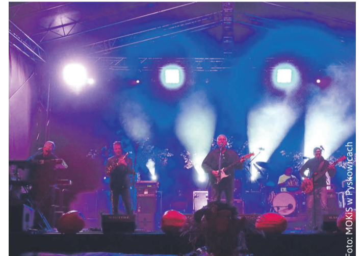
...a w niedzielę koncert zagrały „Elektryczne gitary”.