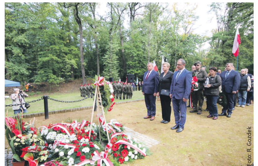
Cześć pomordowanym oddała m.in. delegacja Powiatu Gliwickiego.