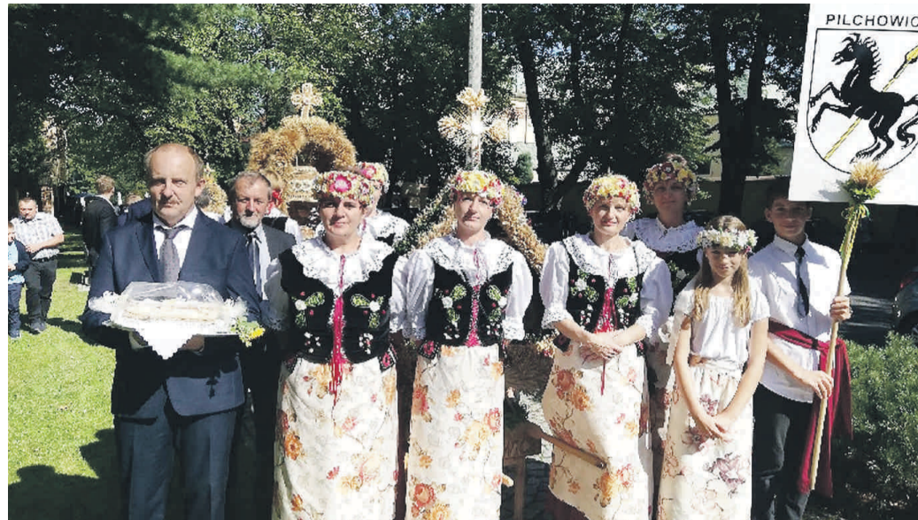
W Rudach pięknie prezentowało się sołectwo Leboszowice.