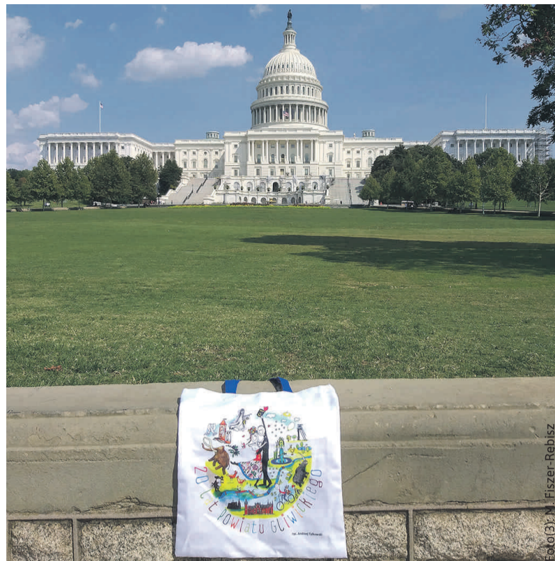
... i Capitolu.

zaciekawienie obecnych tam ludzi. Wielu z nich podejrzewało nawet, że szykujemy jakąś akcję protestacyjną (a takich kilka właśnie się odbywało pod Białym Domem). Byliśmy więc bacznie obserwowani, ale po bliższym przyjrzeniu się naszej kolorowej torbie, amerykańscy gapię oraz odwiedzający z całego świata serdecznie pozdrawiali Polskę, a także