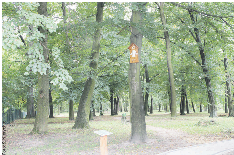
Park w Pilchowicach zachwyca o każdej porze roku.

biowie Wengerscy... To właśnie w Pilchowicach wybudowana została ich