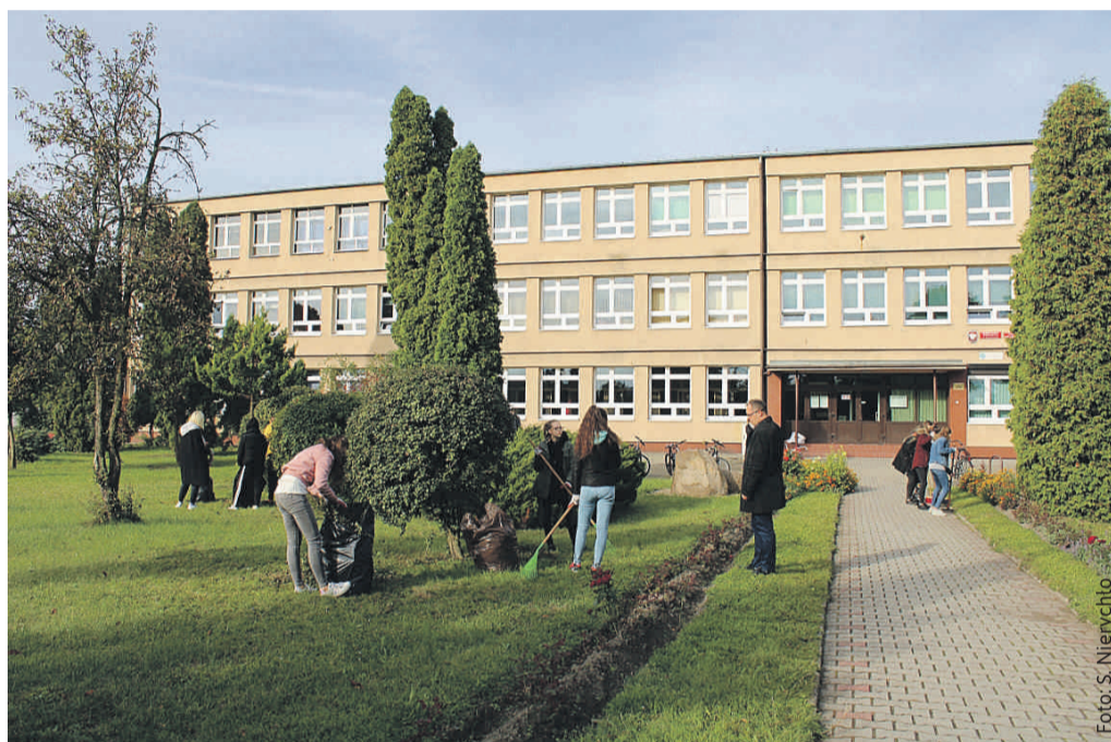
W akcję aktywnie włączyła się m.in. młodzież z Zespołu Szkół im. I. J. Paderewskiego w Knurowie.

Na naszym terenie akcja przebiegała pod nazwą „Sprzątamy Powiat Gliwicki 2019”. 20 września uczniowie powiatowych szkół ponadpodstawowych i specjalnych oraz mieszkańcy domów pomocy społecznej wyruszyli w teren. Młodzież z Zespołu Szkół im. I. J. Paderewskiego w Knurowie, Zespołu Szkół Zawodowych nr 2 w Knurowie, Zespołu Szkół Specjalnych w Knurowie, Zespołu Szkół im. M. Konopnickiej w Pyskowicach oraz Zespołu Szkół Specjalnych w Pyskowicach, a także mieszkańcy DPS-u „Zameczek” w Kuźni Nieborowskiej, DPS-u „Ostoja” w Sośnicowicach oraz DPS-u dla Dzieci i Młodzieży w Pilchowicach z zapalem i zaangażowaniem wysprzątały tereny wokół swoich placówek, parki, place zabaw, przydrożne rowy.