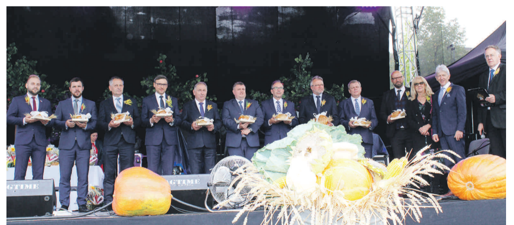
Starostowie dożynek przekazali chleby wóldarzom powiatu, gmin i przedstawicielowi województwa.