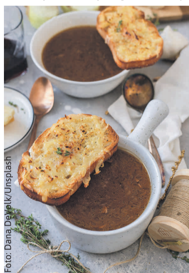
Grzanka z serem to bardzo dobry dodatek do zupy grzybowej.

Wykonanie: Włoszczyznę i ziemniaki obieramy, wrzucamy do garnka, dodaje-