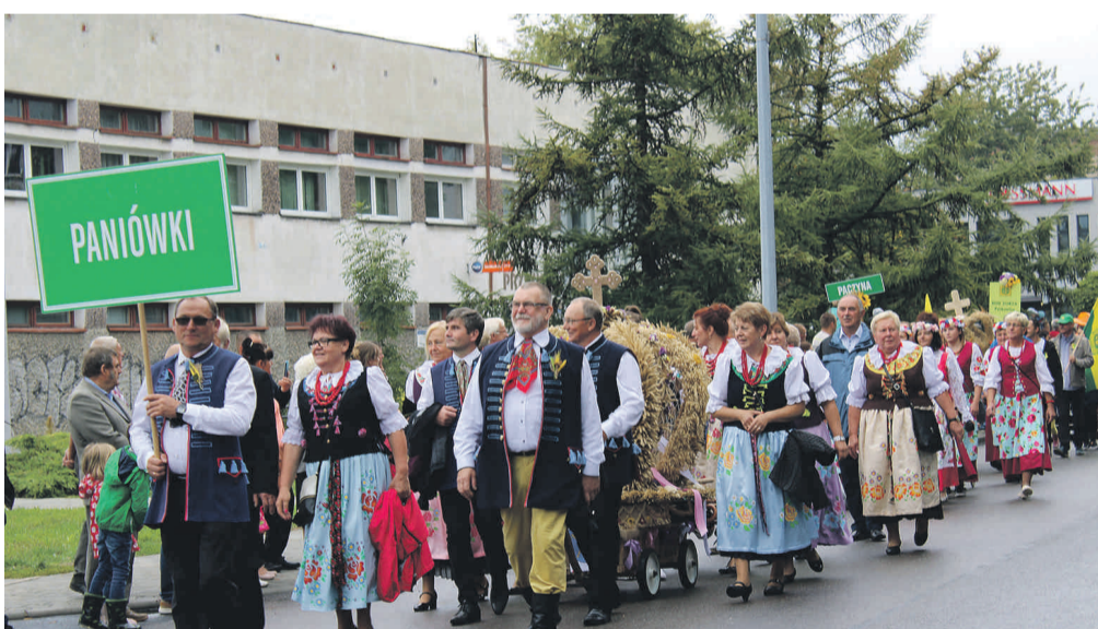
Korowód prezentował się wspaniale i przyciągnął licznych obserwatorów.

Serdecznie dziękujemy wszystkim, którzy zaangażowali się w organizację XXVI Dożynek w Pyskowicach a zarazem XXI Dożynek Powiatu Gliwickiego.