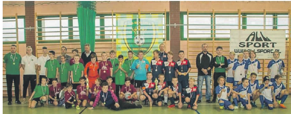
Młodzi zawodnicy z Bargłównki.

Ludowe kluby sportowe z Bargłównki, Łanów Wielkich, Rachowic (gm. Sośnicowice) i Paczyny (gm. Toszek) są bohaterami kolejnej odsłony naszego cyklu, przedstawiającego LKS-y z powiatu gliwickiego.