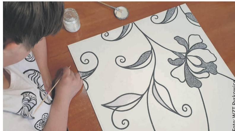
Uczestnicy zajęć mogą wykazać się wieloma talentami.

oraz usprawnieniu widzenia. Podopieczni wyjeżdżają na basen, biorą udział w licznych zawodach, na miejscu korzystają zaś z sali gimnastycznej. W WTZ prowadzone są również zajęcia ogólnorozwojowe, edukacyjne – nauka pisania i czytania, rozpoznawania wartości nominalnych pieniężnych, umiejętności gospodarowania środkami finansowymi.