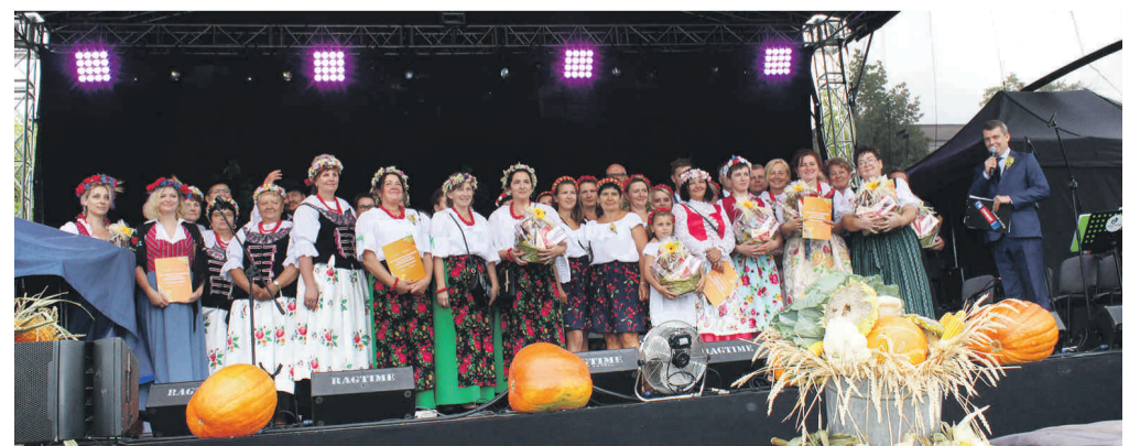
Serdeczne podziękowania otrzymali m.in. twórcy dożynkowych koron.