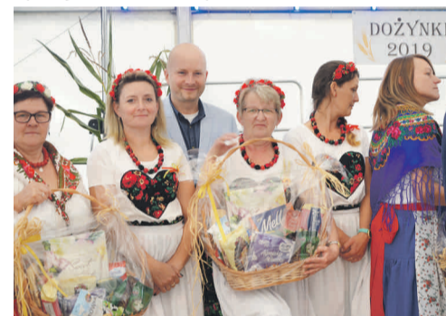
Dożynki to czas podziękowań i gratulacji.

Podczas uroczystego otwarcia obchodów burmistrz Toszka podziękował rolnikom za pracę i przywitał licznie przybyłych gości, a następnie uhonorowano wyróżnionych rolników i sołtysów z gminy Toszek. Po części oficjalnej zabawa nabrała bardziej swobodnego charakteru i bawiono się do późnych godzin wieczornych.