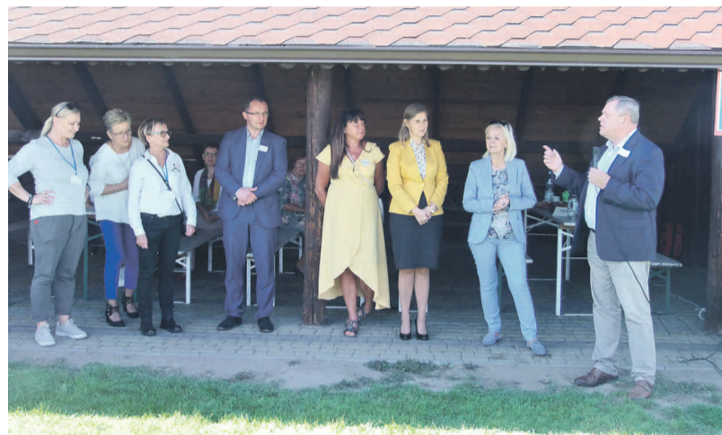
Uroczyste otwarcie imprezy.

Dla wszystkich przygotowano grillowane pyszności oraz słodki poczęstunek. Bezinteresowne wsparcie przedsięwzięcia okazały Stowarzyszenie „Pilchowiczanie Pilchowiczanom”, częstu-