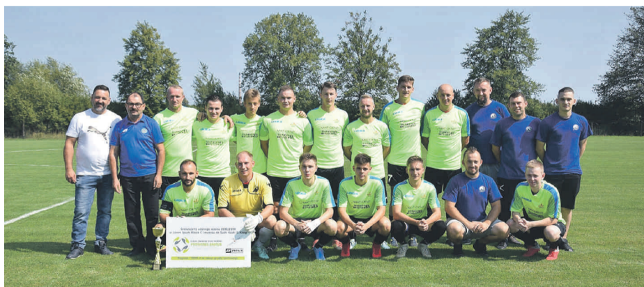
Zawodnicy „Orla” Paczyna z gratulacjami za udany sezon.

„Orzeł” pomaga w organizacji festynów kościelnych i różnego rodzaju przedsięwzięć na terenie sołectwa Paczyna.