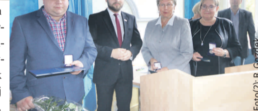
Na sesji uehonorowani zostali zasłużeni mieszkańcy powiatu.

Na sesji podjęliśmy kilka uchwał. Dotyczyły one rozpatrzenia petycji w sprawie utworzenia Młodzieżowej Rady Powiatu Gliwickiego, pozbawienia kategorii drogi powiatowej ulic Górnosławskiej i Ludowej w Toszku, odpłatności za pobyt w domach dla matek z małoletnimi dziećmi i kobiet w ciąży oraz zmian w wieloletniej prognozie finansowej i w tego-