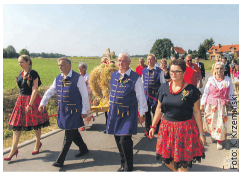
Jeden z barwnych korowodów w gminie Pilchowice.