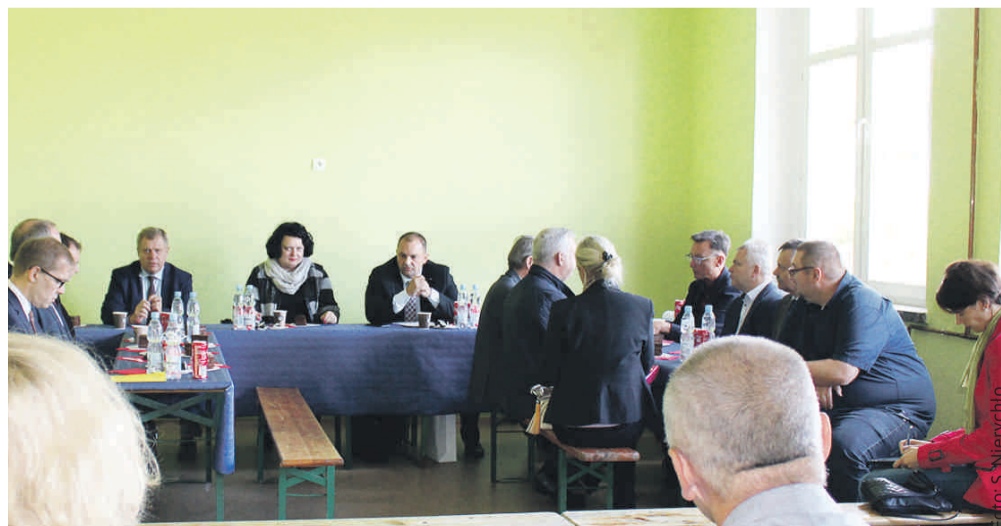
Podczas wyjazdowego posiedzenia Komisji Ochrony Środowiska i Energii w Trachach.