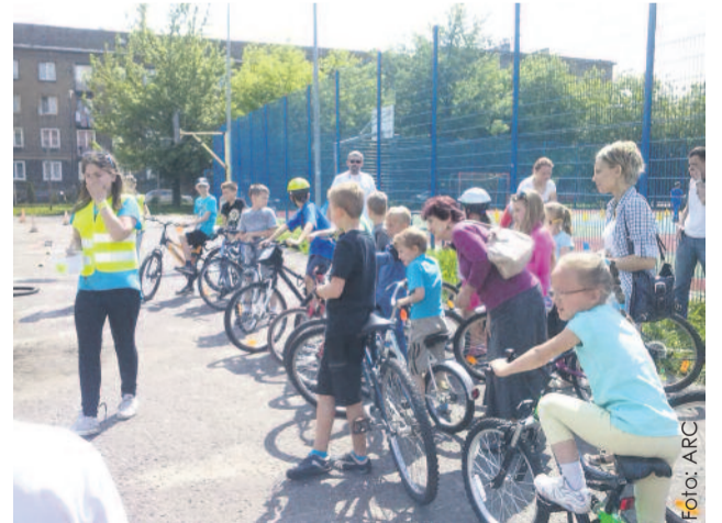
Przed wakacjami był dobry czas na przypomnienie zasad bezpieczeństwa na drodze.

Organizatorzy szczególnie podziękowania kierują do przybyłych wolon-