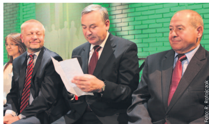
Pytania uczestnikom konkursu zadawali m.in. starostwie.

W finale w studio katowickiej TVP wzięło udział 14 zwycięzców poprzednich etapów konkursu. W pierwszej rundzie poziom był wyrównany. O wynikach zmagania zdecydowała druga runda. Uczestnicy losowali w niej pytania, które czytali partnerzy konkursu, m.in.