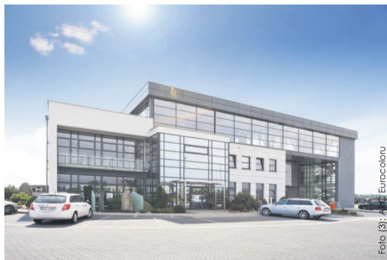
Siedziba Eurocoloru w Pyskowicach.

czesna linia produkcyjna. Dziś Eurocolor posiada trzy nowoczesne hale produkcyjne i magazyny o łącznej powierzchni 50 000 m 2 , współpracuje z ponad 500 partnerami krajowymi i zagranicznymi, jego produkty nie tylko trafiają na polski rynek, ale eksportowane są także m.in. do Czech, Niemiec, na Słowację i znalazły już tysiące nabywców.