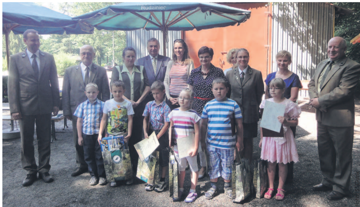
Podsumowanie konkursu sprawiło dużo radości zarówno laureatom, jak i jego organizatorom.

Lista nagrodzonych zamieszczona jest na stronie www.katowice.la-