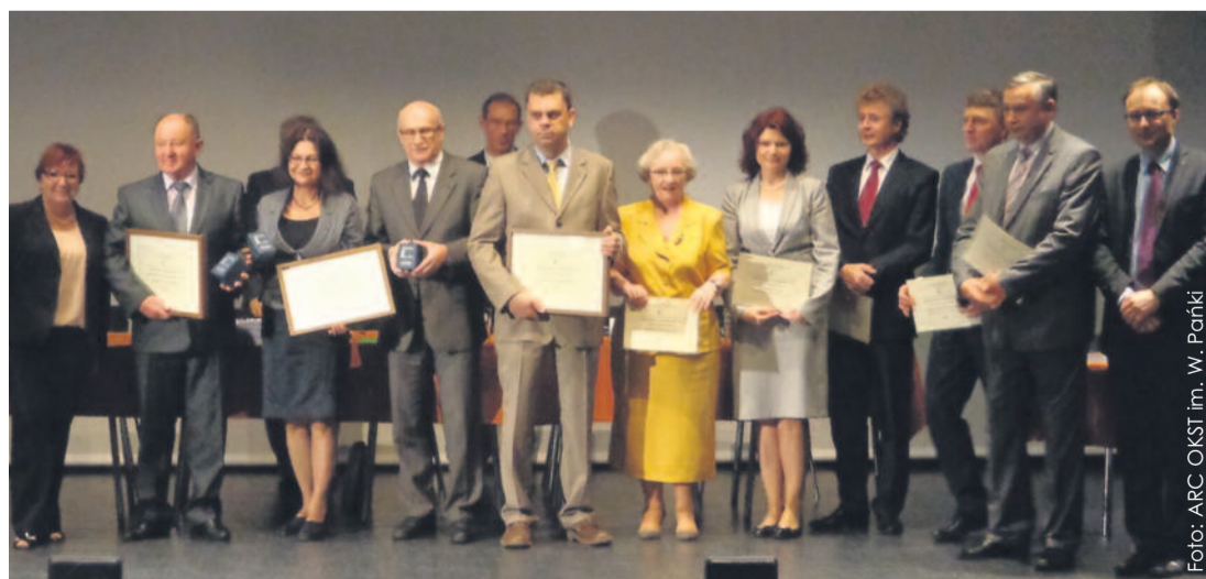
Grono nagrodzonych i wyróżnionych samorządowców.