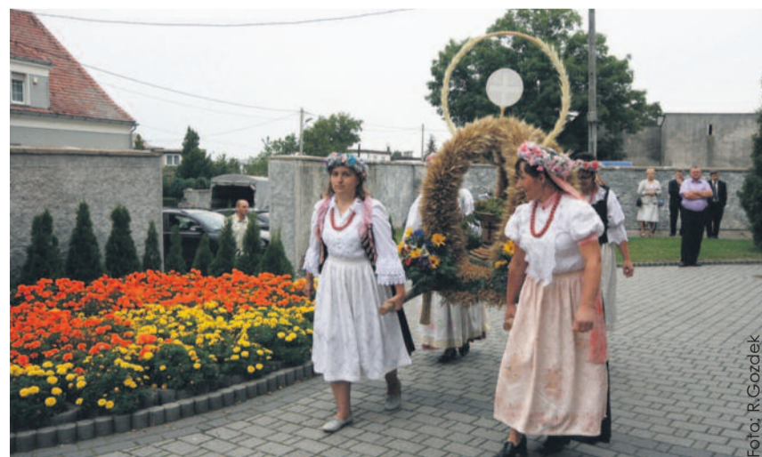
W ub. roku świętowaliśmy w Wielowsi, w tym będziemy dziękować za plony w Pyskowicach.