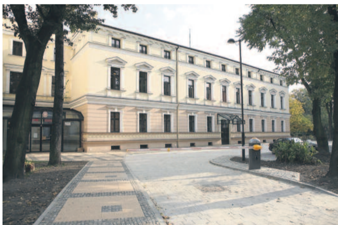
Jednym z budynków poddanych termomodernizacji przy wsparciu środków WFOŚiGW w Katowicach jest Starostwo Powiatowe w Gliwicach.

– Z okazji jubileuszu proszę przyjąć serdeczne życzenia i wyrazy uznania dla Państwa pracy, dla ważnej misji i osobistego zaangażowania nie tylko w ochronę środowiska, ale też promowania nowoczesnych postaw ekologicznych. Wysoko cenię, że system finansowania ochrony środowiska w Polsce, stworzony przez Państwa we współpracy z Narodowym Funduszem,