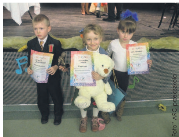
Finaliści konkursu „Muzyczna kraina przedszkolaka”.