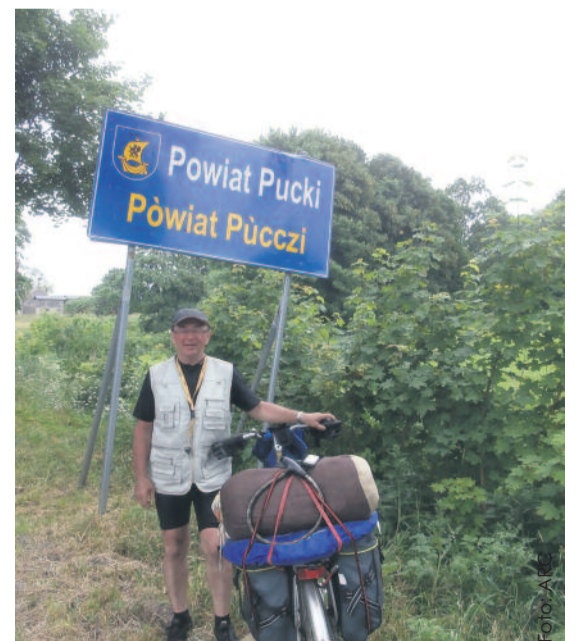
U kresu podróży z całym ekwipunkiem na rowerze.