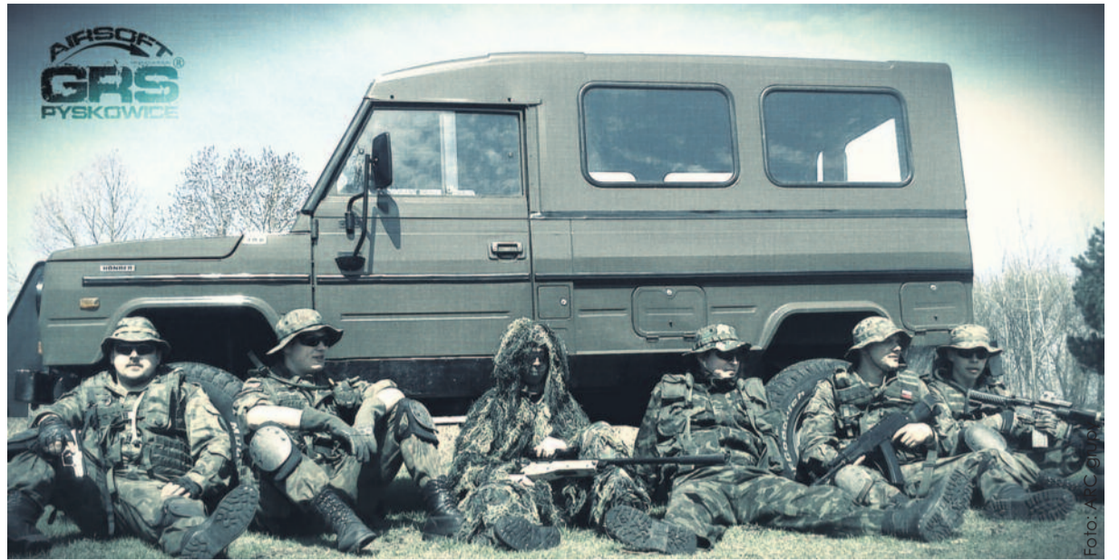
Na pierwszy rzut oka trudno ich odróżnić od prawdziwych jednostek wojsk specjalnych.

Sam ma bogate doświadczenie, ponieważ kilka lat zawodowo służył w ar-