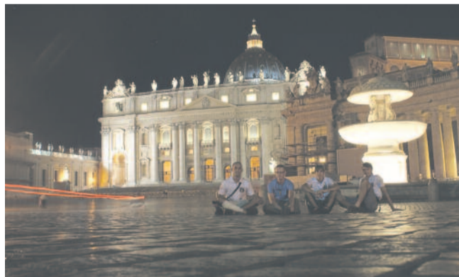
W ub. roku dojechali do Rzymu – na zdjęciu podczas nocnego zwiedzania miasta.

Rowerzystów można wspierać na stronie pyskowskiej parafii www.parafiapyskowice.pl oraz na Facebooku. Zdjęcia z ich ubiegłorocznej