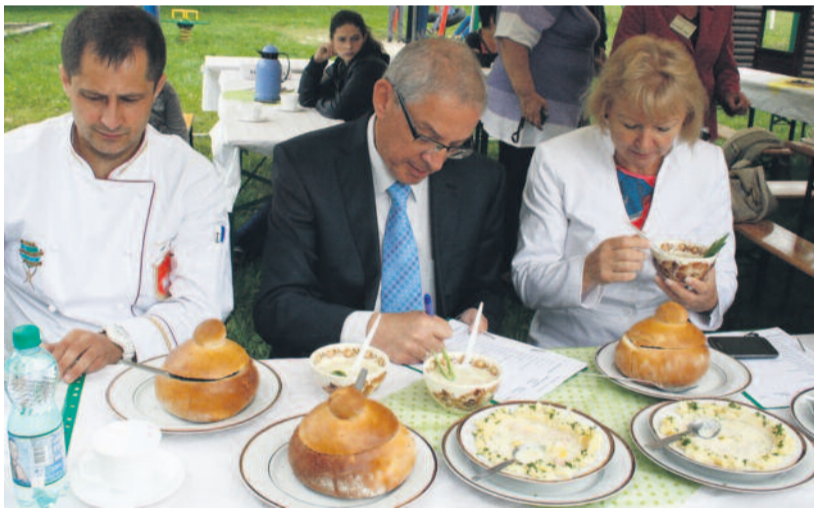
Jury miało niełatwe zadanie, by z 18 wybrać najlepszy.