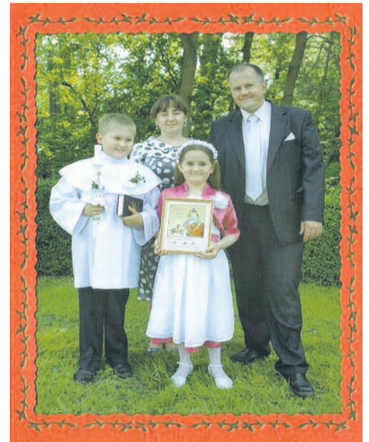
Zdjęcie z mojej Pierwszej Komunii Świętej.

Jest jeszcze jedno podanie dotyczące Studzionki, już w średniowieczu znanej jako Źródło Miłości. Gdyby wytryskającej tu wody zakosztowali razem: młodzieniec i panna, to zakochaliby się w sobie