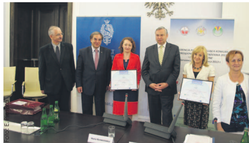
Reprezentanci naszego powiatu z przedstawicielami organizatorów konkursu w siedzibie Senatu RP.

rowerowej dla mieszkańców zachodniej części subregionu centralnego” Powiat Gliwicki został laureatem w dziedzinie sportu i rekreacji. Eksperti oceniający zgłoszone na konkurs rozwiązania docenili zwłaszcza kompleksowość oferty promocyjnej w ramach pierwszego z wymienionych projektów (powstały książki, film, nagranie dźwiękowe i wystawa, zebrane materiały zaprezentowano w telewizji, prasie i internecie) oraz fakt, iż jest to element konsekwentnie od lat podejmowanych przez powiat działań na rzecz ocalenia lokalnego dziedzictwa kulturowego. Drugi z nagrodzonych projektów umożliwił stworzenie spójnej sieci tras rowerowych łączących wszystkie gminy powiatu gliwickiego i zachęca-