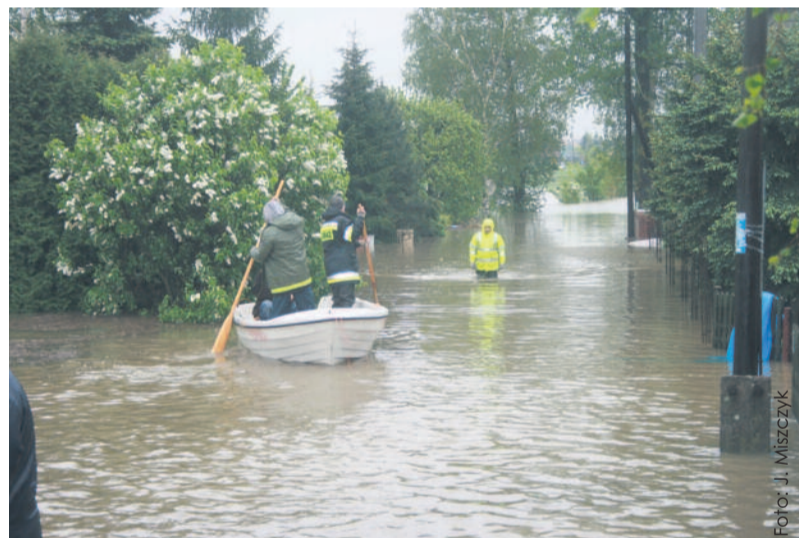
Tak wyglądała ul. Brzeg w Przyszowicach podczas powodzi w maju 2010 r. Zbiornik Racibórz Dolny zwiększy bezpieczeństwo przeciwpowodziowe również na naszym terenie.