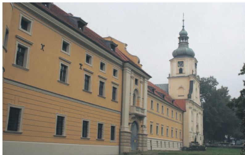
„Sercem” Cysterskich Kompozycji Krajobrazowych jest zespół klasztorno-pałacowy w Rudach Raciborskich.

wy drzewostanu na obszarach Zespołu Parków Krajobrazowych Województwa Śląskiego, którego cysterskie kom-