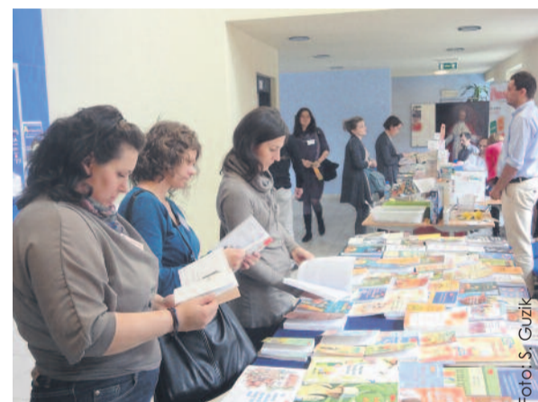
Konferencji towarzyszyły targi edukacyjne.

Organizatorami przedsięwzięcia byli: Stowarzyszenie na Rzecz Ochrony