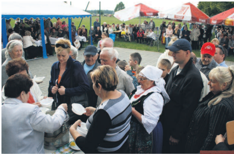
Po doskonały staniccki żur ustawiła się długa kolejka.