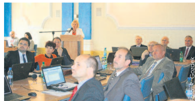
Radni wysłuchali sprawozdania z wykonania budżetu za 2012 r.

opinią Regionalnej Izby Obrachunkowej w Katowicach, informacją o stanie mienia komunalnego oraz pozytywną opinią Komisji Rewizyjnej Rady Powiatu Gliwickiego. Rada przyjęła uchwałę w sprawie absolutorium niemal jednogłośnie – 21 radnych było za jej podjęciem tylko przy jednym głosie wstrzymującym się. Wykonanie budżetu za 2012 r. przedstawia się następująco: dochody – 71 316 488 zł, wydatki – 70 512 632 zł, nadwyżka – 803 856 zł. Warto przypomnieć, że w ub. roku powiat zrealizował szereg poważnych inwestycji, m.in. ukończona została budowa hali sporto-