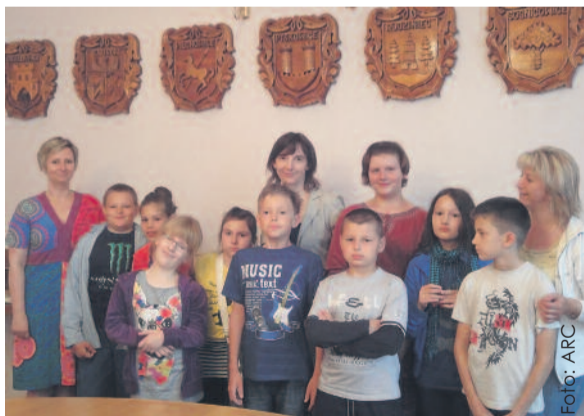
Na koniec wizyty uczniowie wraz ze swymi opiekunkami ustawili się do pamiątkowego zdjęcia w sali, gdzie co tydzień ma swe posiedzenia Zarząd Powiatu Gliwickiego.

nerskimi powiatami powiatu gliwickiego: Mittelsachsen i Calw w Niemczech, Denbighshire w Walii oraz polskim Powiatem Puckim. Uczniowie doskonale radzili sobie z obsługą info-