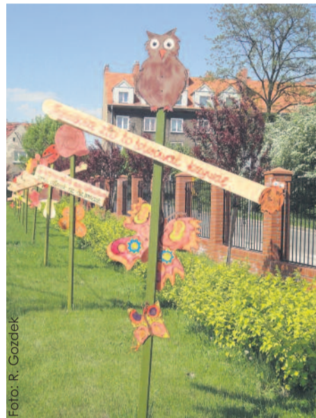
Barwne tablice przyciągają wzrok i skłaniają do refleksji.