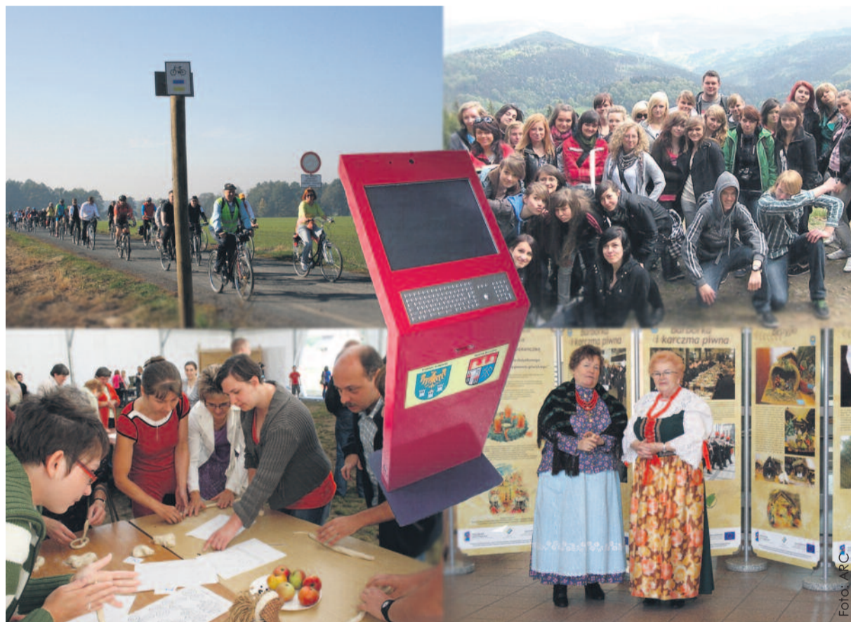
Trasy rowerowe, dodatkowe zajęcia szkolne, wyrównywanie szans niepełnosprawnych i dzieci pozbawionych rodziny, promocja lokalnych tradycji i obrzędów, a także PIAP-y – to wszystko realizowane było z myślą o mieszkańcach powiatu.

Dwa kolejne projekty zaliczone zostały do finału konkursu. Jest to „Edukacja dla rozwoju” – projekt, dzięki