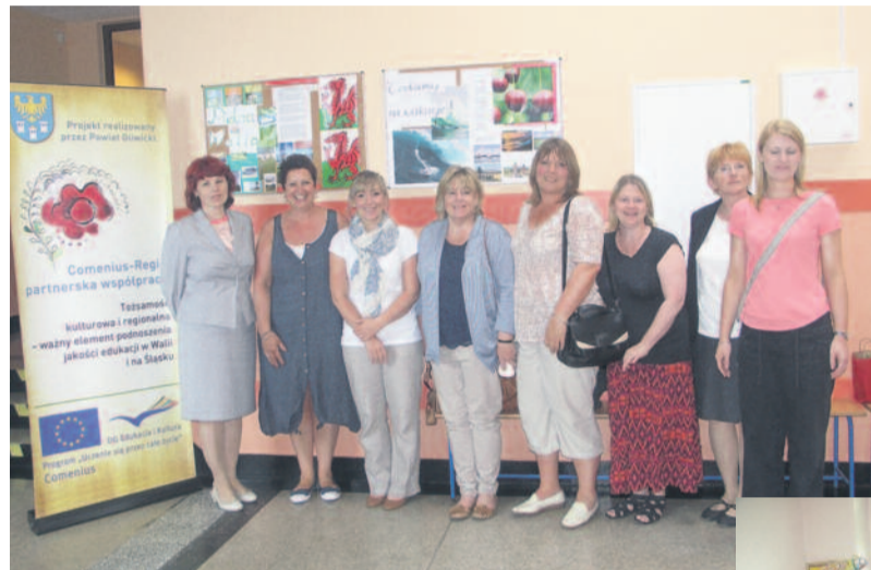
W Zespole Szkół Specjalnych w Knurowie.

Wszyscy bardzo miło i serdecznie przyjęli gości, okazując im ogromne zainteresowanie i wyrażając uznanie dla ich pracy. Wszyscy bardzo miło i serdecznie przyjęli gości, okazując im ogromne zainteresowanie i wyrażając uznanie dla ich pracy.