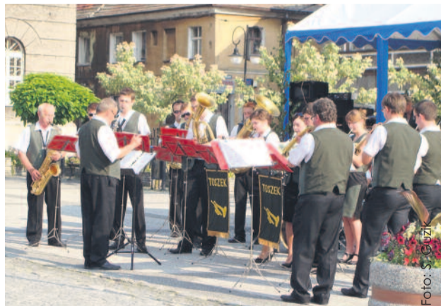
Występy perfekcyjnie przygotowanych orkiestr zawsze budzą zachwyt.

Od 30 lat w Paryżu organizowana jest impreza pn. Fête de la Musique, której idea szybko podbiła świat. Tego dnia na ulicach gószczą muzyka, śpiew i taniec. Po raz trzeci Święto Muzyki odbyło się także w Toszku.