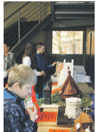
Szczególne wrażenie robiły prace przestrzenne – makiety i budowle w miniaturze.