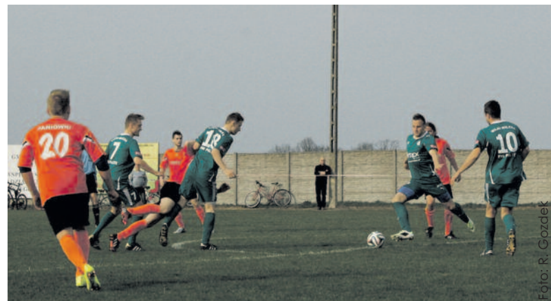
„Wilki” (w zielonych strojach) na swoim boisku z „Tempem” Paniówki.

W wilczańskim klubie stawia się zarówno na piłkę nożną, jak i na inne dyscypliny sportu. Poza drużyną okręgową w „nogę” grają tu także panie, których drużyna jest w trzeciej lidze oraz juniorzy starsi (podokręg zabrzański SZPN) i oldboje mający mistrzostwo powiatu. W klubie działają również sekcje skata sportowego, wędkarstwa sportowego, trampkarzy młodszych i szybko rozwijająca się sekcja jiu-jitsu. Klub ma dobrą, wciąż udoskonalaną bazę sportową. Przy boisku do piłki nożnej powstało ostatnio zadanie dla publiczności, koszt którego pokryła gmina Pilchowice, fundusz sołecki Wilczy i środki od strategicznego sponsora klubu – firmy ATEX.