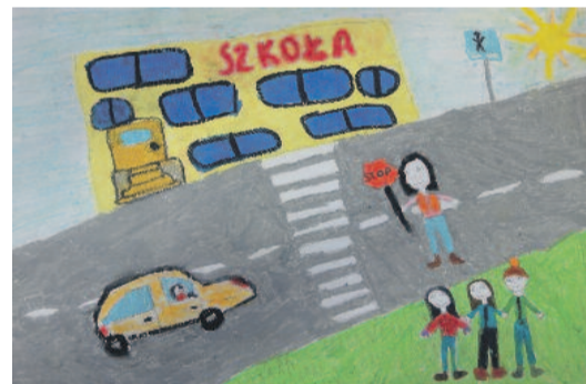
Tak bezpieczną drogę do szkoły przedstawia jedna z konkursowych prac.

Konkursu Plastycznego dla Dzieci i Młodzieży pod hasłem „Bezpieczeństwo i rozwaga – tego od Ciebie każdy wymaga!”.