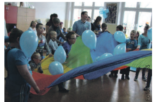
Niebieski kolor zdominował obchody Światowego Dnia Wiedzy o Autyzmie w Zespole Szkół Specjalnych w Knurowie.

nizowana 21 kwietnia w Domu Kultury w Szczygłowicach przez Miejskie Przedszkole nr 13 z Oddziałami Integracyjnymi i Poradnię Psychologiczno-Pedagogiczną w Knurowie. Prelekcjom wygłoszonym w czasie jej trwania przysłuchiwali się m.in. pe-