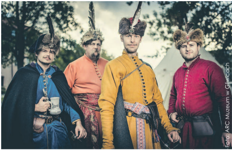
Małopolska Zgraja Sarmacka zawita do Gliwic, by przybliżyć nam czasy szlacheckie.

Organizatorzy tegorocznej Nocy Muzeów w Gliwicach przygotowali ją z istic szlachecką fantazją. W ogrodzie Willi Caro obóz rozbiła Małopolska Zgraja Sarmacka – wyjątkowa grupa rekonstrukcyjna, przybliżająca kulturę i obyczaje XVII-wiecznej szlachty. A to nie jedyna atrakcja nocy z 16 na 17 maja.