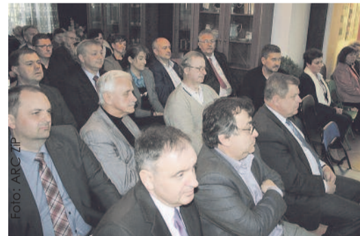
Podczas spotkania w Gminnej Bibliotece Publicznej w Wielowsi.

Podczas zebrania omówiono plany na przyszłość i dalsze zadania, jakie stoją przed Stowarzyszeniem. Spotkanie było także okazją do poznania, a zarazem promocji gminy Wielowieś. Jego uczestnicy odwiedzili m.in. Gminną Bibliotekę Publiczną oraz zwiedzali wyremontowany budynek skansenu w kompleksie pałacowo-