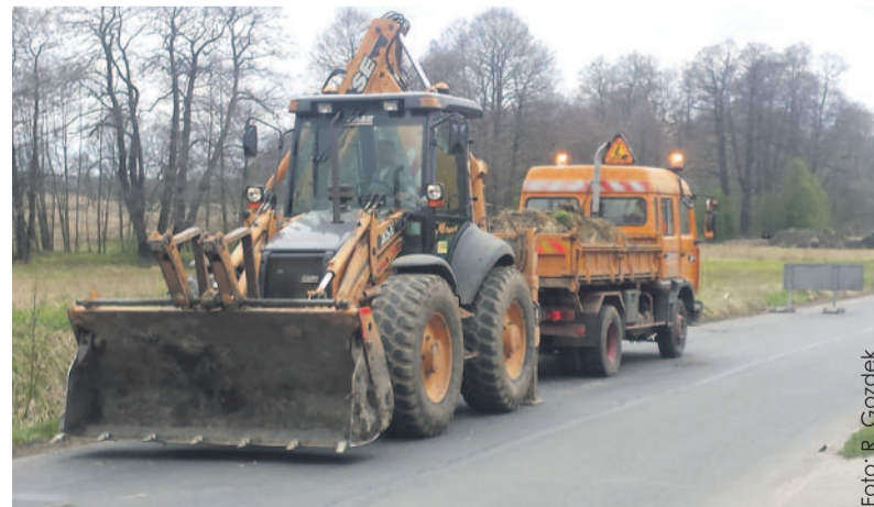
Droga łącząca Wilczę z Pilchowicami długo czekała na remont. Teraz są tu już drogowcy i ciężki sprzęt.