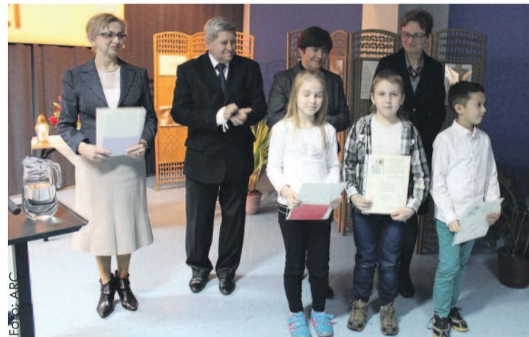
Podczas uroczystości podsumowano konkurs, poświęcony ks. Robocie.