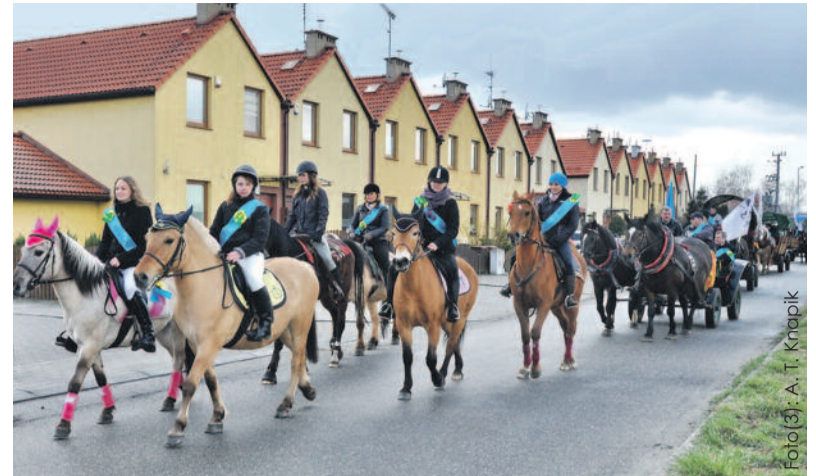
W procesjach konnych niegdyś jeździli tylko mężczyźni, teraz się to zmieniło i w Żernicy można było zobaczyć w niej wiele dziewcząt.

Mimo niesprzyjającej pogody jeźdźcy przez kilka godzin krążyli po okolicy. Procesję zakończyło wesołe spotkanie w domu kultury w Żernicy, na którym były konkursy dla dzieci i dorosłych. Ich zwycięzcy odebrali na-