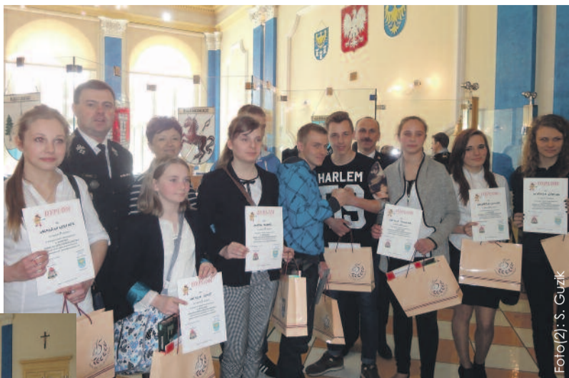
Szczęśliwi laureaci konkursu po odebraniu nagród – wraz z jego organizatorami.

Celem konkursu było popularyzowanie wiedzy oraz edukacja z zakresu bezpieczeństwa – w szczególności w zakresie ratownictwa i ochrony przeciwpożarowej. Wzięło w nim udział 73 uczniów, którzy – podzieleni na trzy grupy wiekowe – pisali test. Powodzenia życzyli