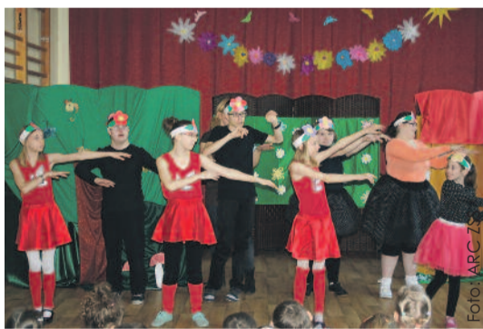
Uczniowie przygotowali przedstawienie teatralno-muzyczne, które goście nagrodzili gromkimi brawami.