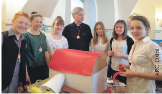
Impreza udowodnia, że Papież Jan Paweł II wciąż inspiruje młodych ludzi.