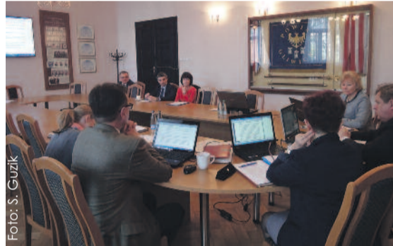
Tym razem na posiedzeniu Zarządu Powiatu gościli szefowie „Unii Brackiej” i knurowskiego ZOZ-u.

Zarząd Powiatu Gliwickiego na swym posiedzeniu 14 kwietnia zajmował się m.in. sprawą podstawowej opieki zdrowotnej świadczonej dla mieszkańców Knuruwa-Szczygłowic.