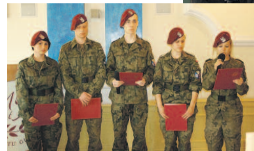
Młodzież II LO w Knurowie zaprezentowała patriotyczny występ poświęcony 3 Majowi.