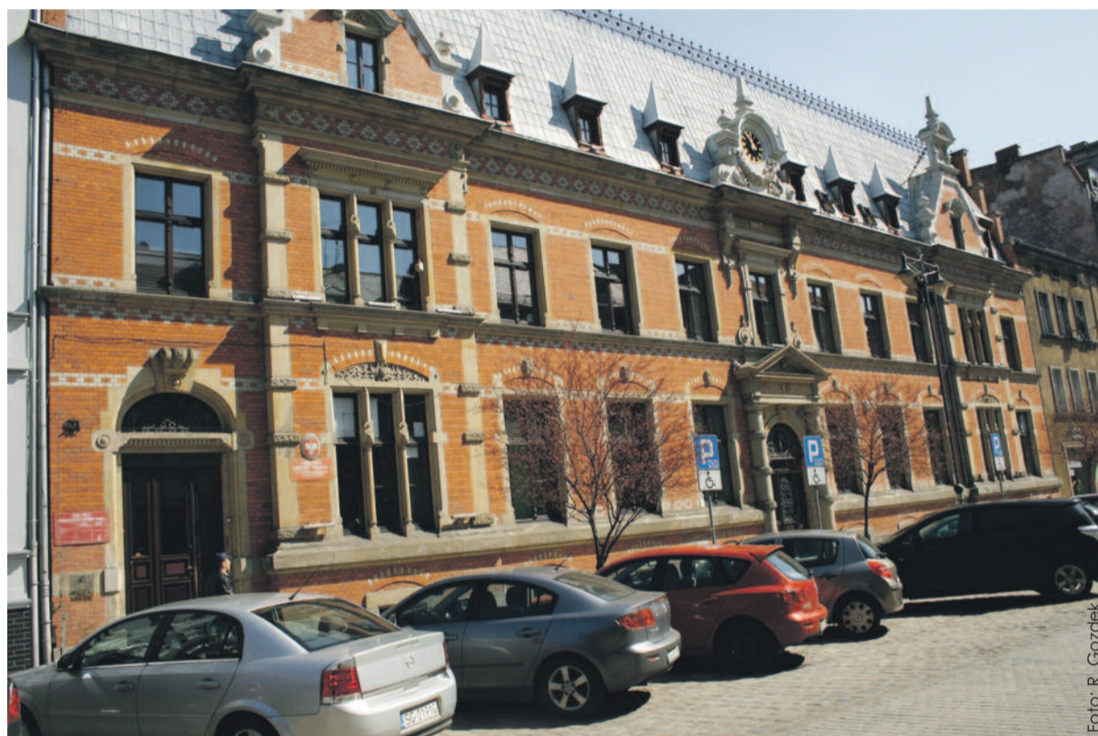
Powiatowy Urząd Pracy w Gliwicach służy zarówno mieszkańcom miasta, jak i powiatu gliwickiego.

Rozmową z dyrektorem Powiatowego Urzędu Pracy w Gliwicach rozpoczynamy cykl artykułów poświęconych sprawom bezrobocia i zatrudnienia na terenie naszego powiatu. W następnych numerach WPG zamieszczać będziemy porady i wskazówki przydatne osobom szukającym pracy, udzielane przez pracowników Powiatowego Urzędu Pracy w Gliwicach.