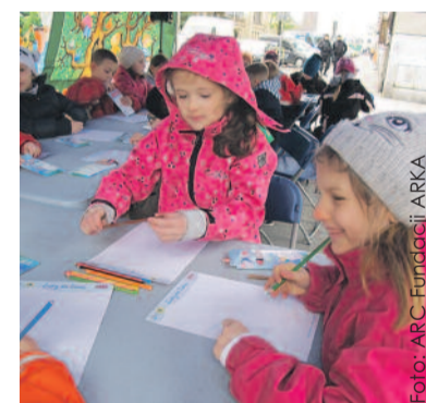
Dzieci piszą do dorosłych, jak ratować Ziemię przed zanieczyszczeniami.