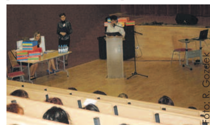
Podczas konferencji „Razem dla autyzmu”.

dagogzy, nauczyciele, pracownicy pomocy społecznej i rodzice. Była to już trzecia taka konferencja i spotkała się z dużym zainteresowaniem, bowiem autyzm diagnozowany jest u coraz większej liczby dzieci.