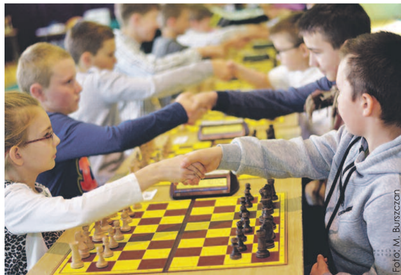
Najmłodszy pokazał, że świetnie radzą sobie z trudną grą.