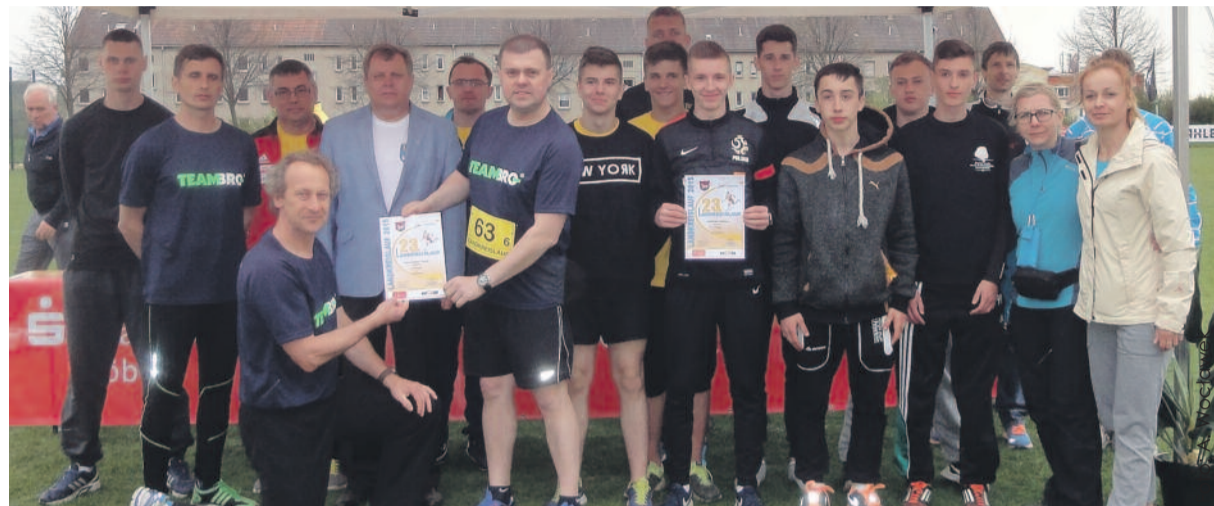
Reprezentanci naszego powiatu w towarzystwie gospodarzy biegu w Mittelsachsen.

Jak zwykle po biegu, w niedzielne przedpołudnie uczestnicy Biegu mogli podziwiać kawałek przepięknego Powiatu Mittelsachsen. W tym roku zwie-