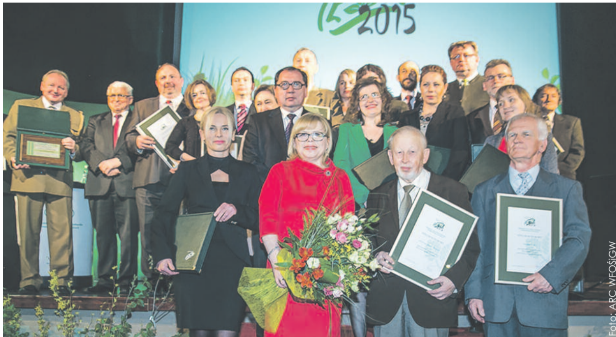
Uroczystość zgromadziła duże grono ludzi oddanych ekologii.

Podczas uroczystej gali w Kinoteatrze Rialto w Katowicach wręczone zostały Zielone Czeki 2015. To doroczna nagroda finansowa przyznawana z okazji Dnia Ziemi. Od 1994 r. nagradzane są nią osoby wyróżniające się w działalności proekologicznej na terenie woj. śląskiego.